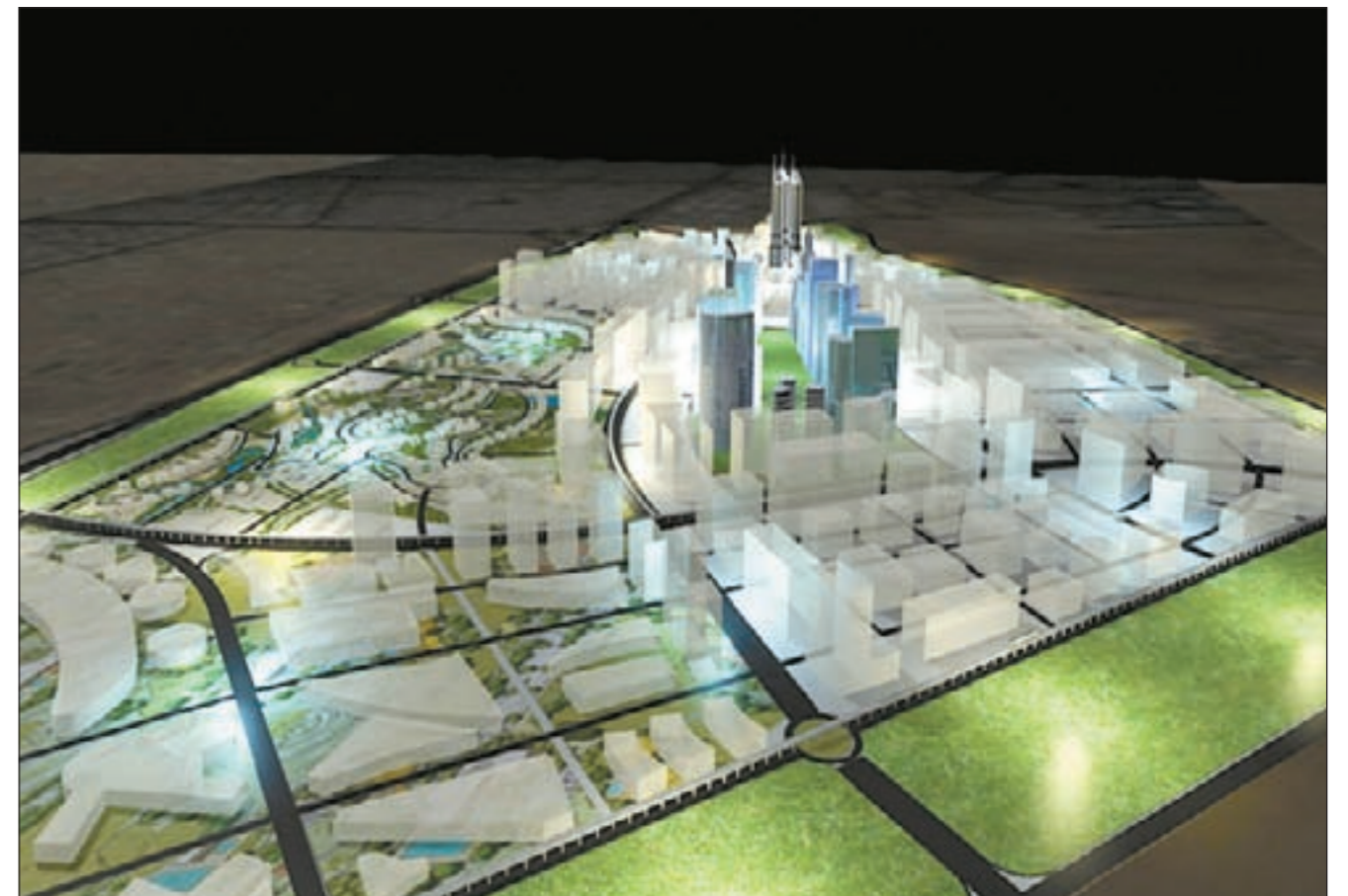
رسم تصويري ثلاثي الأبعاد لمنطقة جلب الشيوخ بحسب تصور المشروع