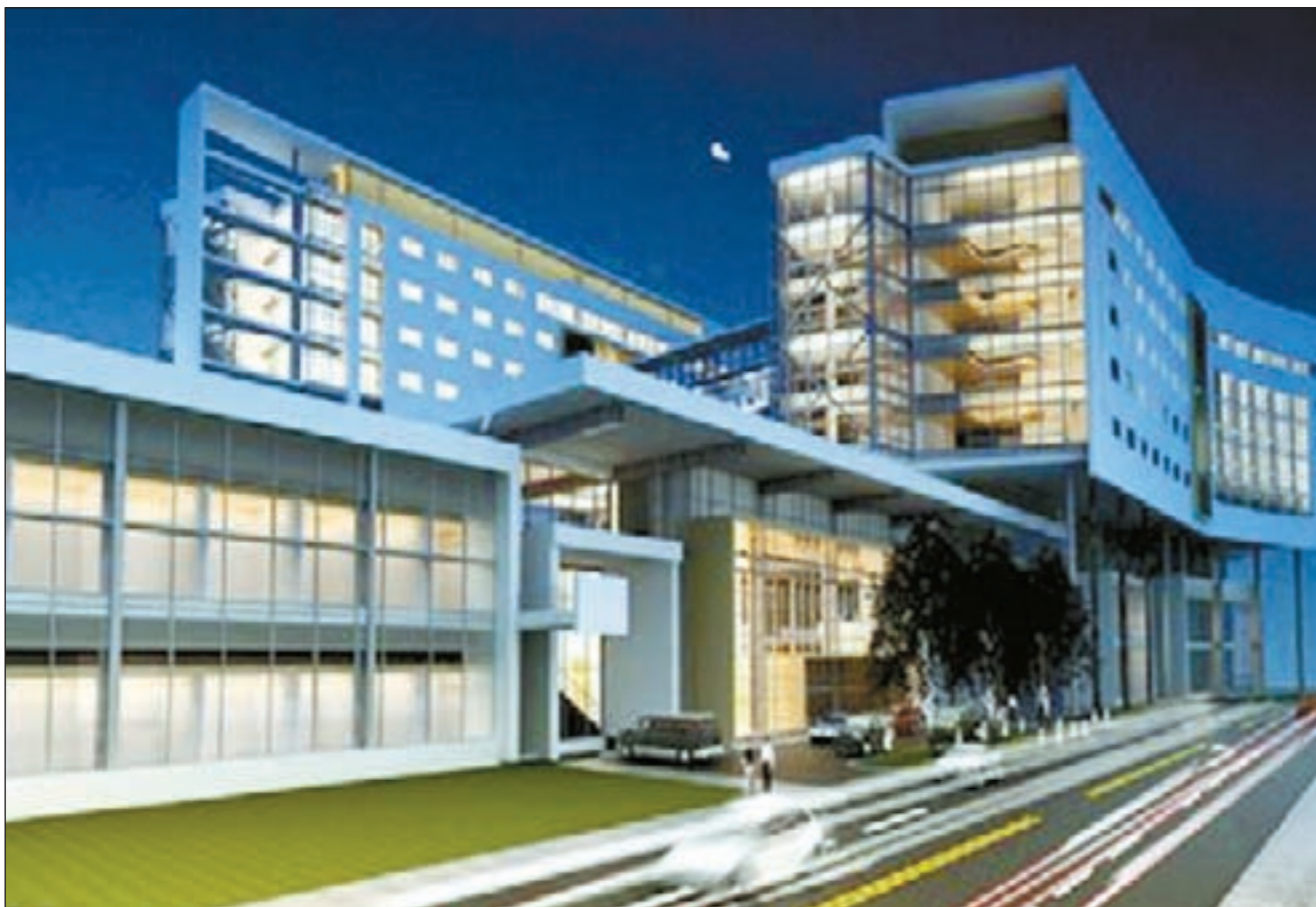
.. وتصور افتراضي للمنطقة الإدارية

وكذلك ستقر المنطقة الثانية التي تضم منطقة الجلب القديمة وجزءاً من الحساوي، والتي ستكون منطقة فنادق ومنتزهات لخدمة ضيوف الكويت من المشاركين بالبطولات،