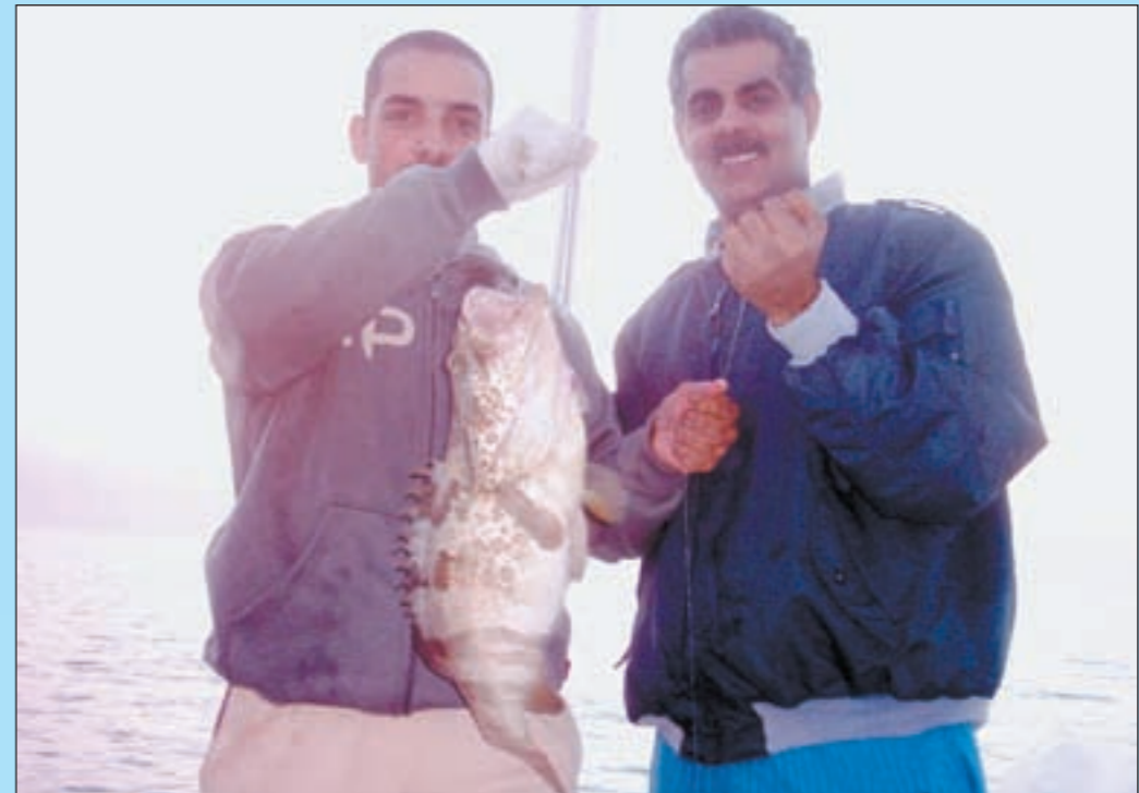
المحمد والمرشود مع هامور اقواق 25