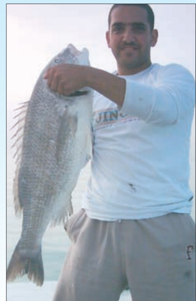
سبيطي الدفان روعة