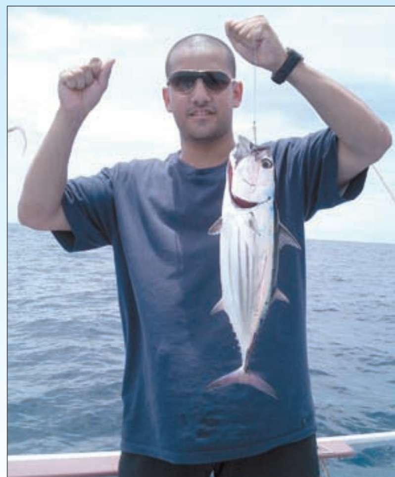
تشخيظ التونة بتايلند