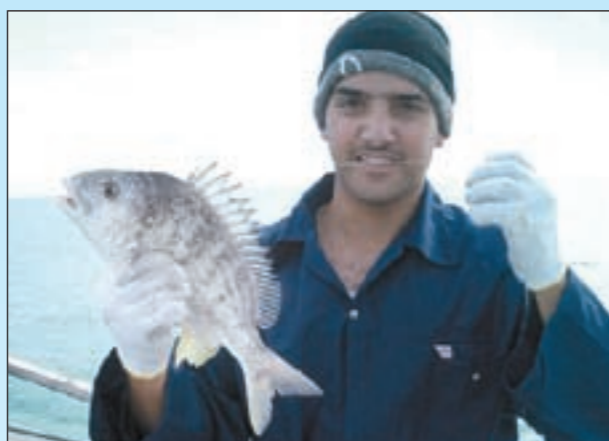
يا سلام على الشعم

متى تتوقف عن الحداق؟ أنا لا أتوقف عن الحداق إلا خلال فترة معينة وهذه الفترة تكون من أول شهر مايو حتى نصف يوليو وبعدها أرجع وأحدق. هل لديك طريقة صيد غير الطريقة التقليدية؟ نعم عندي طريقة ممتعة وجديدة وأكثر الناس الذين يمارسون هذه الهواية يفضلونها فسي أوقات معينة وبأماكن معينة وهذه الطريقة هي التشخيظ ويستخدم فيها ييم صناعي (المجور) بالون وأحجام وأشكال مختلفة. حدثنا عن التشخيظ؟ التشخيظ هواية من الهوايات البحرية الجميلة والمعروفة لدى كثير من الناس وعشاق البحر والصيد وتستخدم طريقة التشخيظ أكثر في المحادق الجنوبية وعلى بعض الأسياف ويعتمد في صيدها على الليمم الصناعي (المجور) طبعاً لهذه الطريقة حسية معينة ومكان ولون المجور وسرعة الطراد وحسبة الغرز وعلى السمكة التي تريد أن تصادها وكل الذي ذكرته يأتي عن طريق الخبرة والممارسة. ما أفضل أماكن التشخيظ؟ الأماكن كثيرة ومتنوعة وأفضلها عندي هي أسياف الفنتاس حتى جزيرة قاروه.