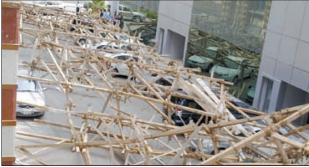
منظر عام لسقوط السقالات فوق السيارات الـ 13