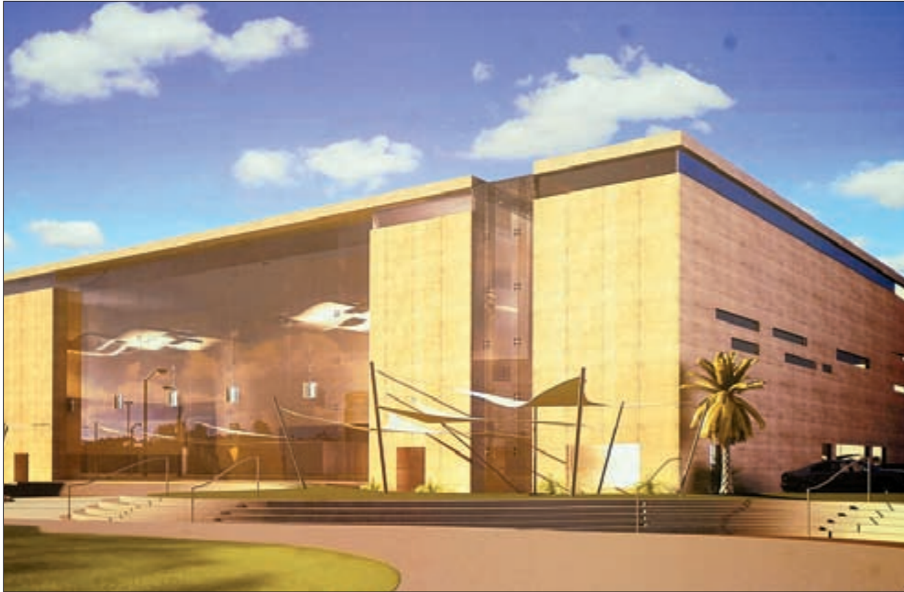
ماكيت لمسرح السالمية