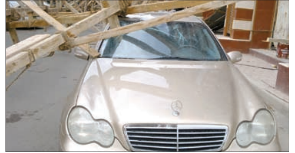
بعض السيارات وقد تحطمت تماما

تسببت الرياح التي ضربت البلاد امس في سقوط اشخاب سقالة منزل تحت الإنشاء في منطقة السالمية ما ادى الى اتلاف 13 سيارة كانت متوقفة اسفل المناية. وبحسب شهود عيان ان الرياح الشديدة التي ضربت صباح امس تسببت في خلخلة اشخاب السقالات التي كانت موضوعة على ارتفاع 4 ادوار لتسقط فوق السيارات المتوقفة اسفلها وتلفها بالكامل. هذا وقام عدد من اصحاب السيارات المتضررة بالتقدم ببلاغ إلى مخفر السالمية وحضر عدد من رجال الامن لمعاينة الموقع وحصر الأضرار قبل تسجيل قضايا لصالح اصحاب السيارات.