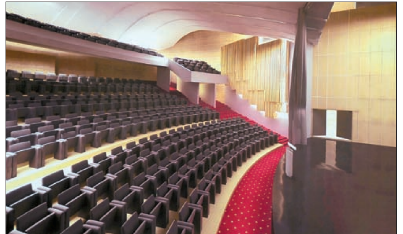
صالة العرض في مسرح السالمية