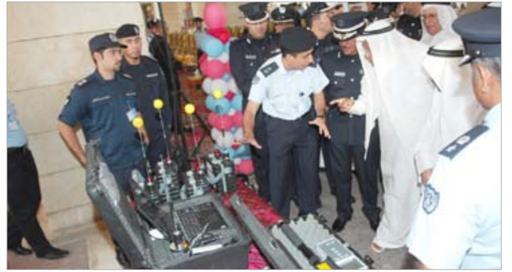
كبار المسؤولين يتفقدون معرض الإطفاء

اعلن مدير الادارة العامة للإطفاء اللواء جاسم المنصوري تأكيده على بدء قبول العنصر النسائي في سلك الإطفاء بونيو المقبل، حيث ستضم الدورة الاولى 20 فتاة وسيكون عملها مراقبة الوقاية والتفتيش وذلك في الاماكن التي تتطلب دخول العنصر النسائي اليها. وكشف اللواء المنصوري، خلال انطلاق أنشطة يوم الإطفاء الثامن بسوق شرق صباح امس المقام تحت رعاية وزير الدولة لشؤون مجلس الوزراء وروضان الروضان والذي سيستمر على مدى اسبوع في جميع محافظات البلاد، ان الادارة العامة للإطفاء انتهت من اعداد كشوف ترقية ضباط الادارة العامة للإطفاء، حيث ستكون تلك الترقيات مع اقرار الميزانية للعام الجديد لبريل المقبل، مشيراً الى ان الادارة ستعد كشوفاً تضم ضباط صف أمضوا بسلك الإطفاء 15 عاماً ليتم ارفاق رتبة ملازم، مؤكداً ان الترقيات ستكون بالاقدمية وتلقائية. وحول ما اشيع عن إيقاف دورة ضباط اطفاء، أكد اللواء المنصوري ان الادارة العامة للإطفاء مكتفية تماما من اعداد ضباط الإطفاء، حيث ارتابنا فتح باب التسجيل العام المقبل لقبول 50 ضابط اطفاء للعام الذي يليه 30 اطفائياً.