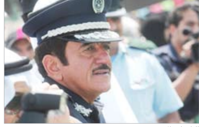
اللواء جاسم المنصوري

المناسبة، ان هذا الاحتفال يأتي تكريماً لرجال الإطفاء وللمساهمة في تحقيق الوعي الاجتماعي للمواطنين والمقيمين. وأوضح الانصاري ان اربعة آلاف رجل اطفاء يعملون في الادارة العامة للإطفاء ويتم تقديم خدمات الطوارئ من خلال 38 مركز اطفاء، مبيّنا ان الخدمات الوقائية يتم تقديمها من خلال اربعة مواقع جغرافية، مشيراً الى ان نسبة الحوادث هذا العام بلغت نحو 13 الفا و500 حادث بانخفاض 8٪ عن العام الماضي، في حين بلغت حرائق المنازل 1500 حريق بانخفاض 6٪ عن العام الماضي، مبيّنا انه زادت نسبة السرعة لاحتواء الحوادث وانخفضت فترة الاستجابة. يذكر ان الاحتفال يقام على مدى اربعة ايام في ستة مواقع موزعة على المحافظات هي مجمع «كويت ماجيك» في منطقة أبو حليفة ومجمع «سبليل الجهراء» ومجمع «العربيد بلازا» وسوق شرق والمارينا مول اضافة الى مركز اطفاء القرين. وتخلل الاحتفال مسابقات وجوائز للمشاركين وعروض لرجال الإطفاء وألياتهم بهدف تشجيع الناس ورفع مستوى الوعي خصوصاً لدى الأطفال وربات البيوت على كيفية التعامل السليم مع الحريق المنزلي وكيفية الوقاية من الحريق ومسبباته.