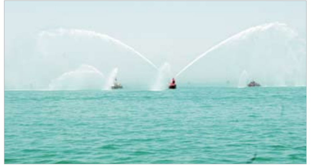
جانب من عرض الإنقاذ البحري