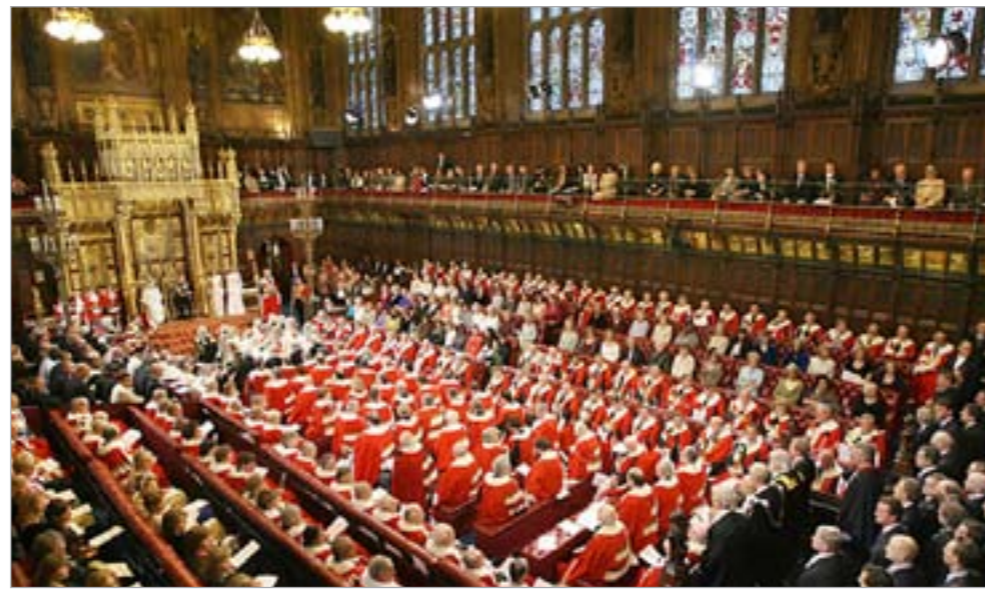
مجلس اللوردات البريطاني في احد اجتماعاته

يعتبر مجلس اللوردات اصل البرلمان الحالي، وخصوصا ان اول مجلس تأسس عام 1295 كان يضم الاساقفة واللوردات واصحاب الالقب الرفيعة وممثلي المحافظات والمناطق.