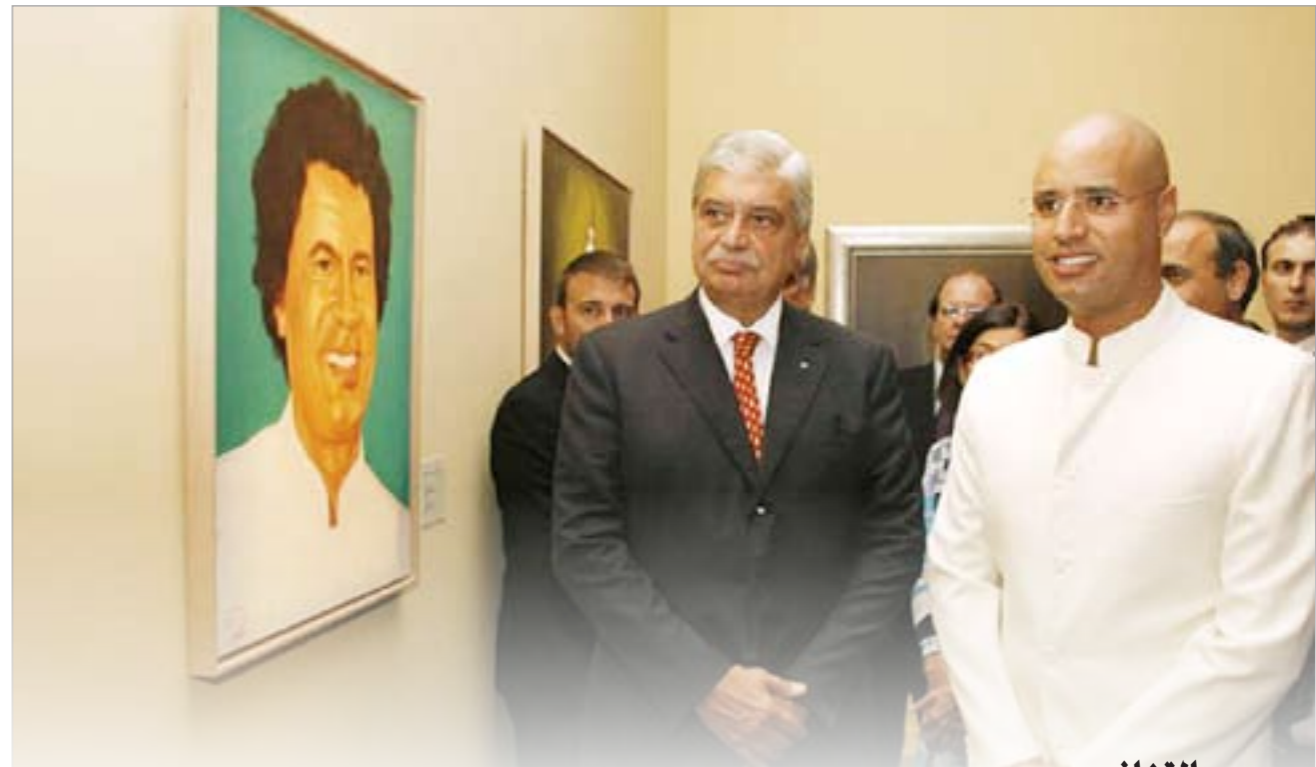
المهندس المعماري والرسام سيف الإسلام القذافي ابن الزعيم الليبي معمر القذافي أمام لوحة رسمها لوالده خلال افتتاح معرضه الفني «الصحراء ليست صامتة» في المتحف الأفريقي البرازيلي في ساو باولو

واشنطن - يو بي آي: اعترفت المغنية والنجمة التلفزيونية الأميركية جيسكا سيمبسون بانها لاتنظف أسنانها وانها تستخدم بدلا من ذلك سائل مضاد للبكتيريا. ونقلت مجلة «يو إس ماغازين» الأميركية عن سيمبسون اعترافها بانها لا تبذل جهدا للحفاظ على صحة أسنانها وهو أمر سيؤدي إلى نتائج صحية سيئة. وقالت «لا أنظف أسناني. حقا، وأستعمل سائل ليسترين وأحيانا أستخدم سترتي». وأضافت «أسناني قوية جدا. وربما حين يصبح عمري 60 عاما سأنظفها جيدا».