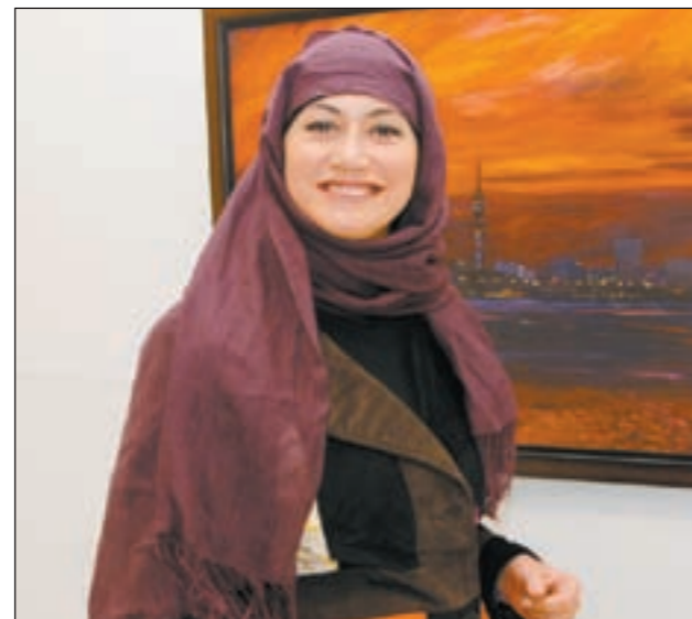
وجه من الحضور