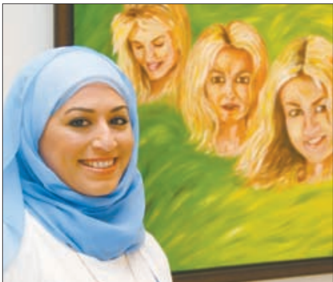
الفنانة وابنتاسمة لـ «الأنباء»