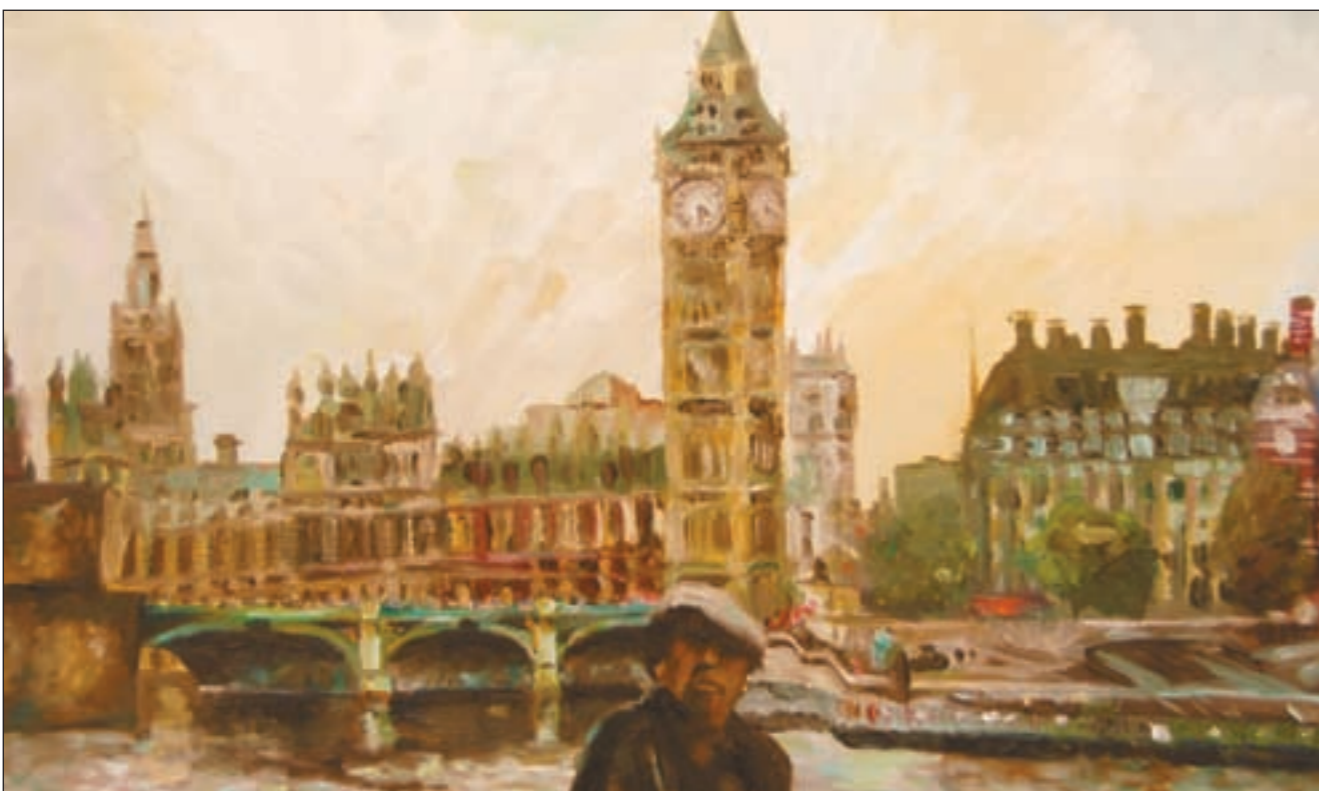
بدر القطامي في لندن