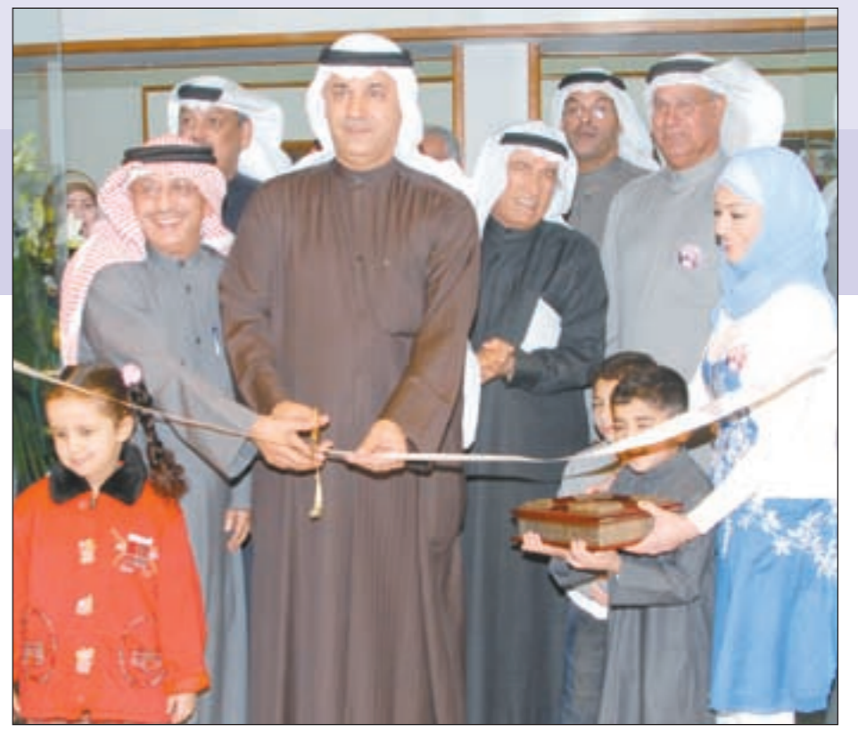
إثناء افتتاح المعرض