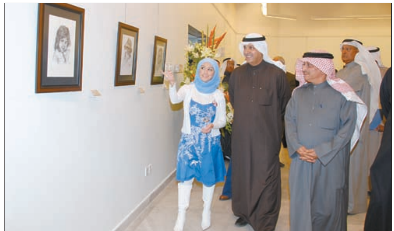
القطامي تشرح للحضور