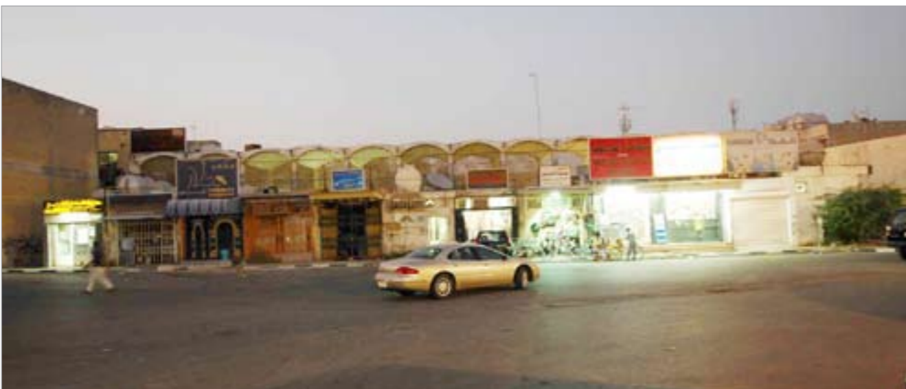
سوق الأحمدي التراثي

كما توقع العويصي ان قضية 10 آلاف لكل مواطن هي دغدغة للشاعر وأمر في منظور الخيال وفي قضية القروض أيضاً، وطبعاً وضحت قضية القروض للسلمطين وأبدوا رأيهم في تلك القضية الآن الكرة في ملعب السلطة التنفيذية إذا أخذت بحلول ناجحة في صندوق المعسرين فإن الشعب سيكون معهم، أو ان مجلس الأمة مضطر في دور الاعتقاد القادم حتى لم توافق عليه الحكومة لإقناده، فيجب على الحكومة ان تقوم ببعض التعديلات على صندوق المعسرين لأن هذا الصندوق في وضعه الحالي فيه ظلم للكثير من المواطنين، خاصة ان الدولة تكثرت في قضية القروض والبنك المركزي لم يقم بدوره على أكمل وجه فالدولة كانت السبب الرئيسي مع المواطن للأمانة. وفيما يخص المنطقة ومشاكلها قال ان هذه مسؤولية تقع على أعضاء مجلس الأمة وهم المنوطون