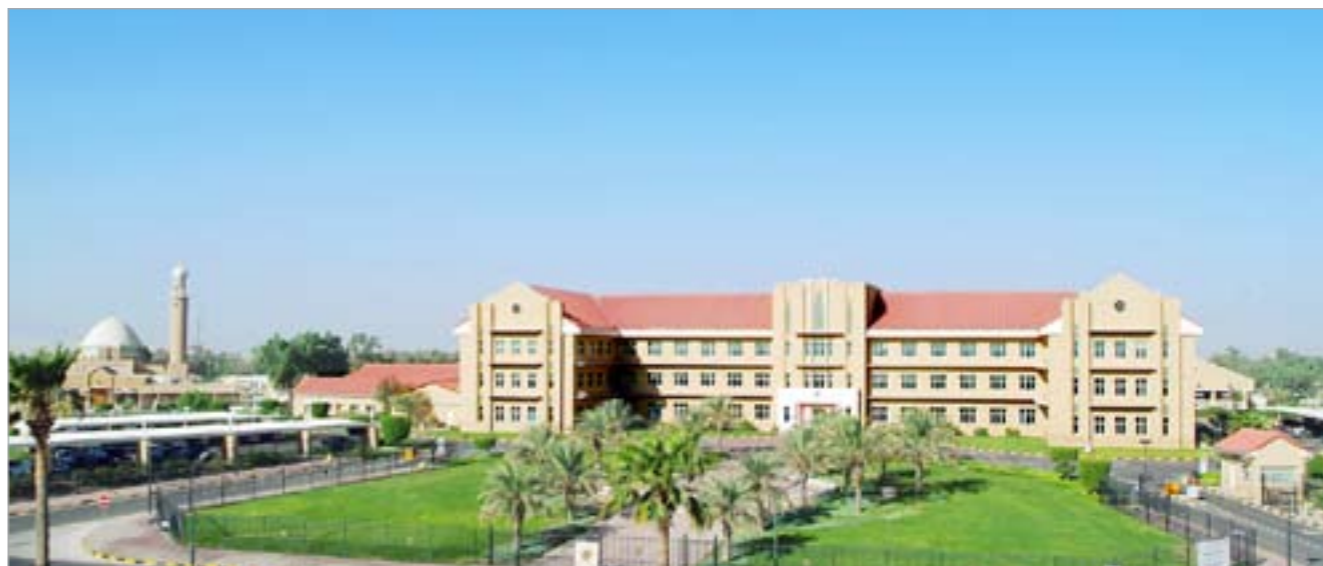
مبنى شركة نفط الكويت