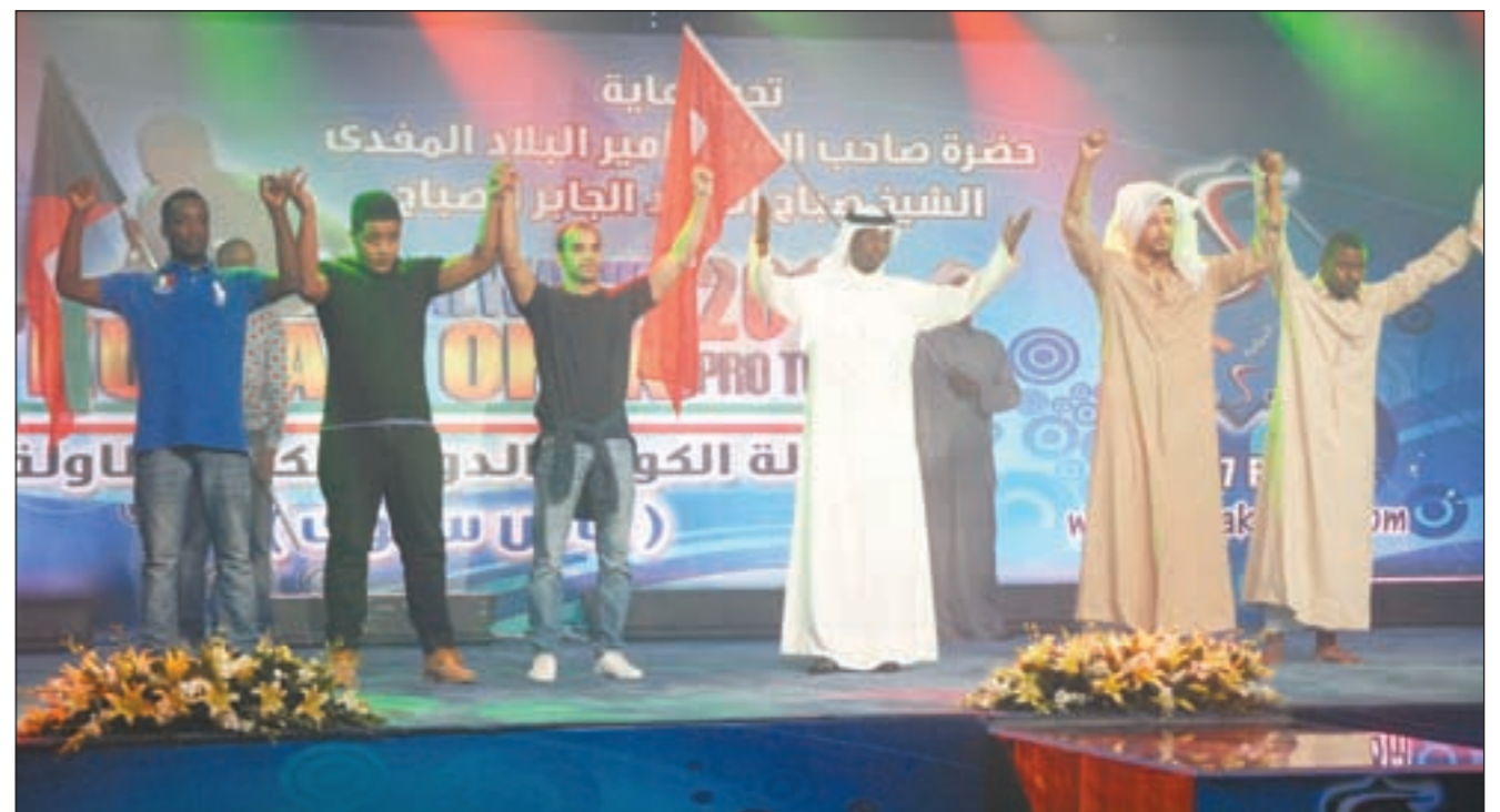
الفنان فواز مرزوق يحيي الجمهور بعد فقرة الماضي والحاضر