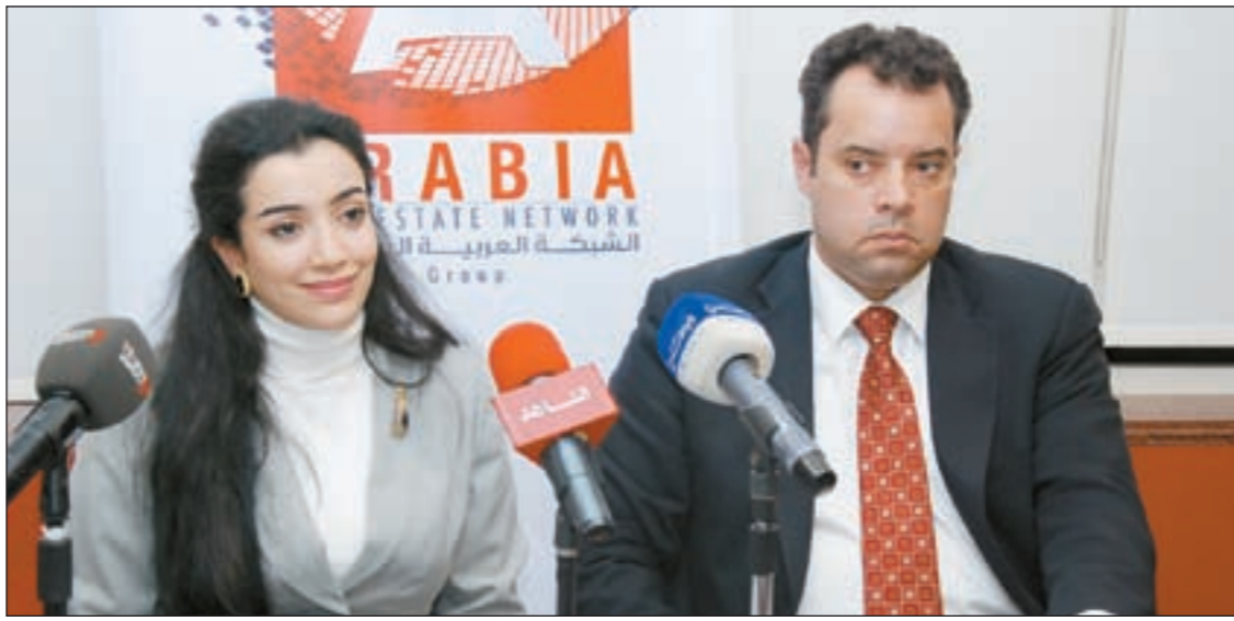
السكرتير رويسون ميلو والسفيرة غدير الصقبي خلال المؤتمر الصحافي

وأكدت الصقبي أنها متفائلة دائماً ولا تحب أن تنقل الصورة السيئة معتقدة أن على الجميع أن يتبع أكثر على بيئته، لأن بيئتنا تحتاج إلى اهتمام والى توعية وهي مشكلة حقيقية، فهناك كثير من الناس لا يعلمون مدى مخاطر المشاكل البيئية الموجودة لدينا، لذلك نحن بحاجة إلى التوعية، لأن الوصول إلى بيئة أفضل يحتاج إلى تعاون الجميع سواء الحكومة أو الشعب أو القطاع الخاص وجمعيات