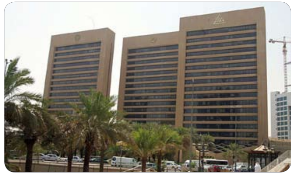
البنوك تضغط على الشركات لتعديل أوضاعها

وفي السياق ذاته، وعلى صعيد ملف الرهونات العقارية، توقعت مصادر لـ «الأخبار» أن البنوك المحلية أمامها خيارات ثلاثة للتعامل مع العقارات المرهونة لديها والتي لن تخرج عن بدائل ثلاثة تتمثل في جدولة القروض المضمونة بعقارات أو إعطاء أصحابها فترة سماح أو