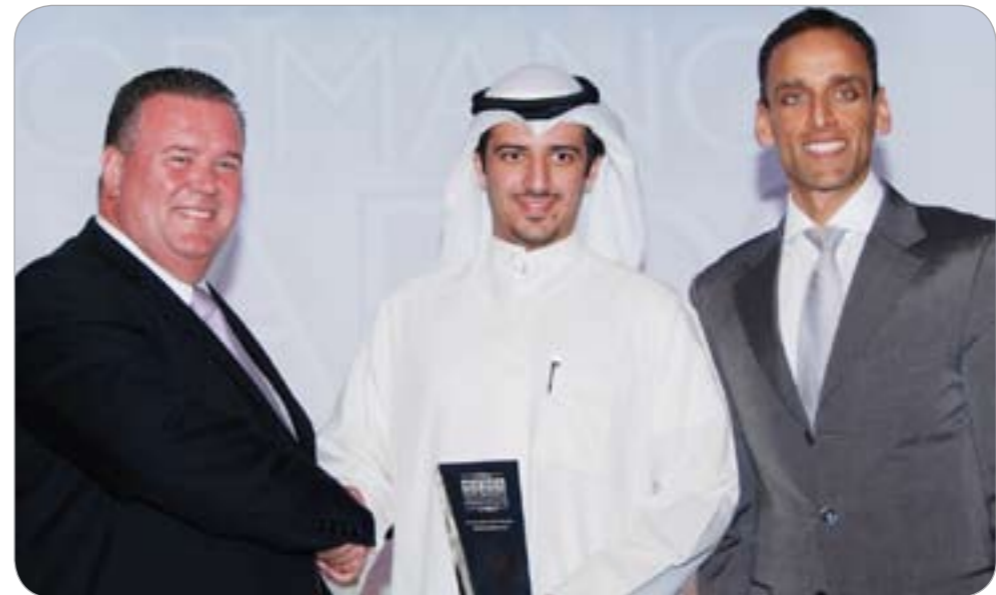
ممثل شركة «المركز» متسلماً للجائزة

صندوق «الممتاز» برتبة «A»، كما أنه حاز ثلاث جوائز من شركة لبير التابعة لمجموعة تومسون رويترز لأفضل العوائد الذين يشكلون خياراً للمؤسسات المهتمة بالاستثمار.