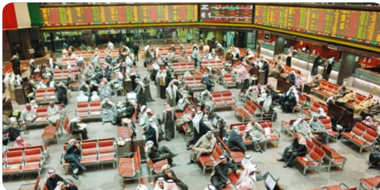
نشاط الأسهم القيادية وتراجع الرخيصة يفسر بصغار المتداولين

تحرك على الأسهم الرخيصة الزائدة وجني أرباح على النشطة خاصة «الصفوة» وشركاتها