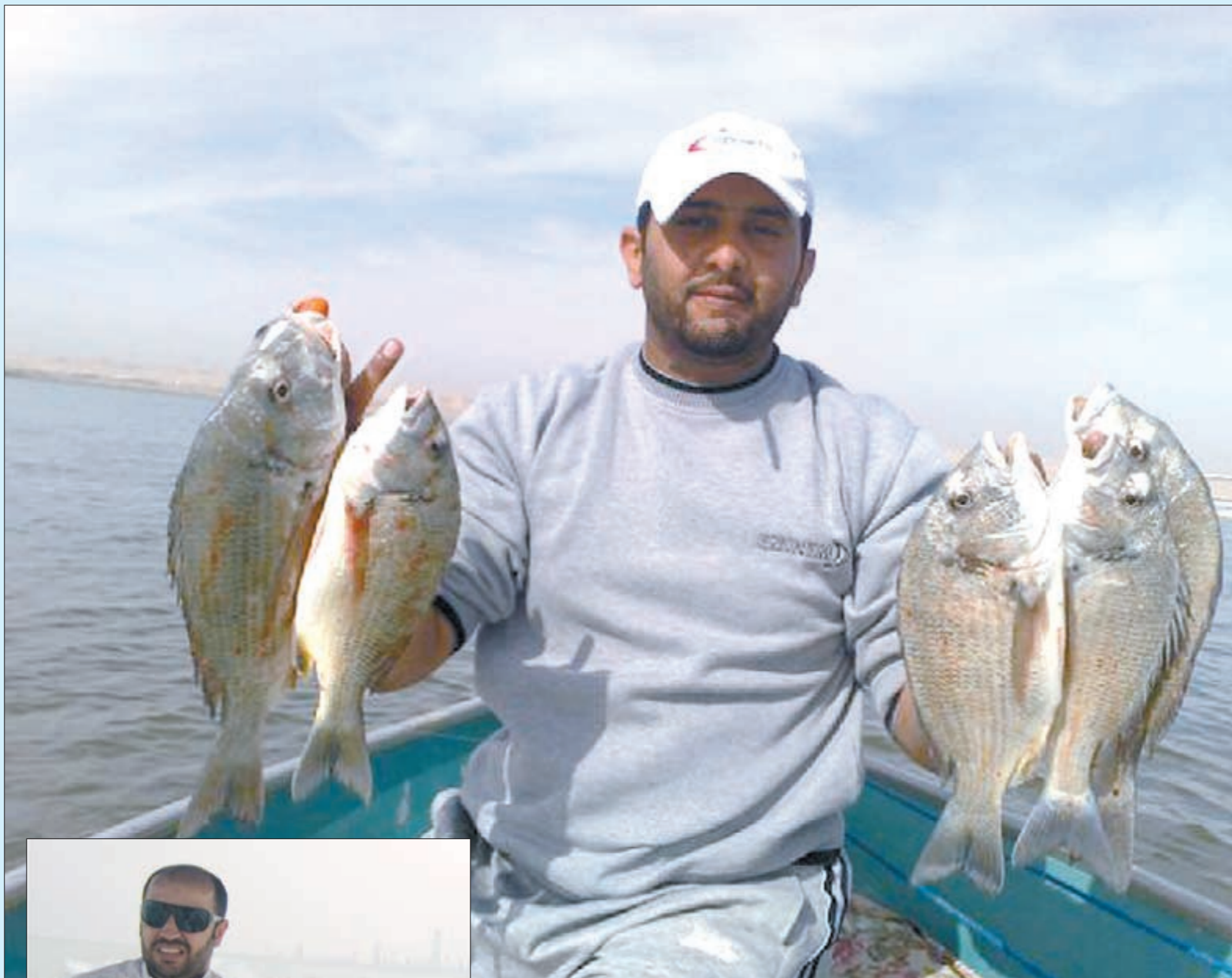
معقولة هذه شعوم.. يا سلام سلم

هناك من يقوم ببيع الأسماك بالمناطق السكنية