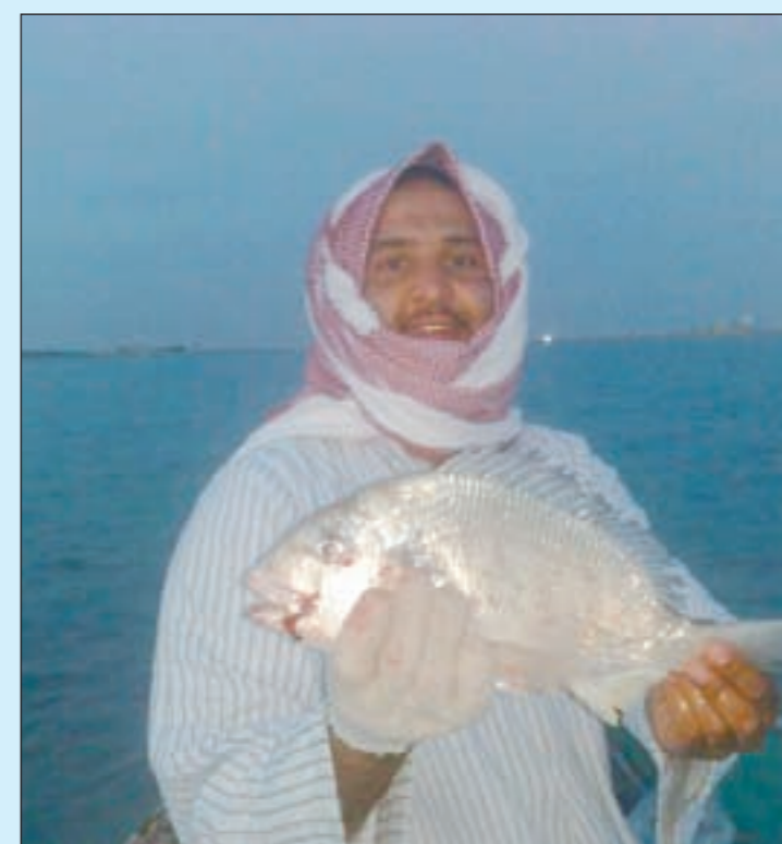
ما أصدق ان هذا شعوم مو معقول