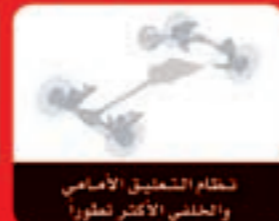
نظام التعليق الأمامي والخلفي الأكثر تطوراً