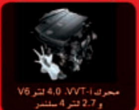
محرك VVT-i 4.0 لتر V6 و 2.7 لتر 4 سلندر