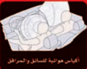
أكياس هوائية للسائق والمراقب

وسل تويوتا فورتنر 2010 الجديد كلياً ليمنحك تجربة قيادة غير مسبوقة في عالم السيارات الرياضية متعددة الاستخدامات (SUV). فورتنر الجديد هو مطلب كل من يعشق الحيوية. أسباب عديدة جعلت من فورتنر أفضل صانداً كالمسرح الاستثنائي مقابل قيمته وجودته، وأيضاً تشعر معه كأنك تقود سيارة صالون إلا أنه بمساحة رحبة لا تشوهر في أي سيارة صالون أخرى. ويمتاز فورتنر 2010 من الخارج بتصاميم ديناميكية تعكس مظاهر القوة والصلابة، إضافة لمقصورة داخلية مريحة وتجهيزات متكاملة تتفهمك وتعزز قدرات القيادة لديك، كما أن نظام التعليق المتطور يمنحك أداءً أفضل على الطرقات الوعرة. فورتنر الجديد متوفر بمحركين 4 سلندر سعة 2.7 لتر، و 6 سلندر سعة 4.0 لتر، ومتوفر أيضاً بـ 4x4 و 2x4. . . لقد حان الوقت لتتمتع بقيادة لم تعرفها من قبل. قم بتجربة قيادته الآن.