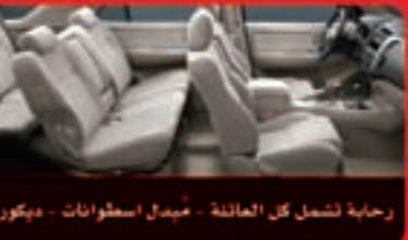
رحابة تشمل كل العائلة - مبدل اسطوانات - ديكور خشب