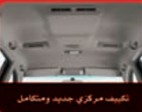
تكييف مركزي جديد ومتكامل