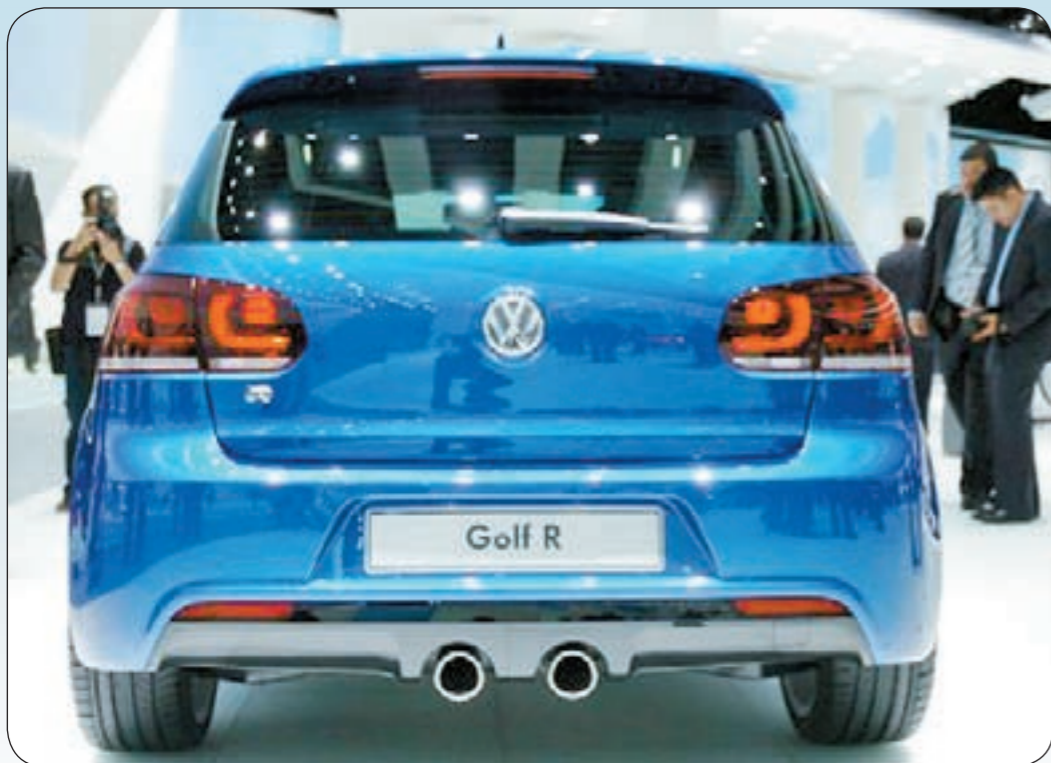
تصميم عصري لسيارات فولكس واجن

أعلنت شركة بهباني للسيارات، الوكيل الحصري لفولكس واجن في الكويت، حصولها على شهادة «سوبربراند» وجاء ذلك تأكيداً لإستراتيجية الشركة للبقاء دوماً في مقدمة الشركات التي تحافظ على المعايير والمقاييس العالمية للجودة في جميع أقسام الشركة.