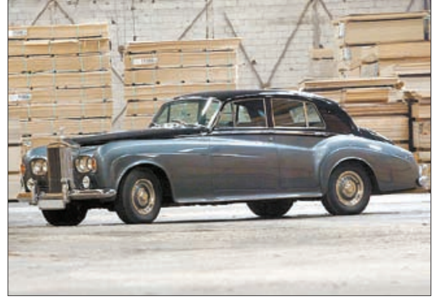
بعض السيارات المشاركة في مهرجان «كويت كونكور دي الجانيس» في صالة العرض المخصصة لاستقبال الجمهور