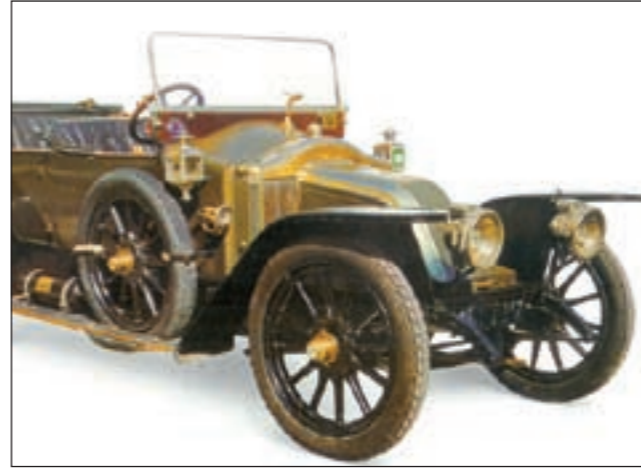
سيارة كلاسيكية تشارك في المهرجان

الإطلاع عن كثب على سيارات فائقة السحر لونها وشكلها ويظهر كيفية استخدام التكنولوجيا للأغراض الفنية السامية في تطويره شيئاً فشيئاً الأمر الذي يستحق المشاهدة والمشاركة. وذكر اسحق إن أي مشاركة مهما كان نوعها في هذا الحدث ستضيف قيمة للمشاركين، هذا غير المتعة التي سينالونها لتأثير المسة الإبداعية والفنية على العقول والنفوس لأن كل سيارة من الزمن الجميل تروي قصة أو حكاية مرت بها. وحول فئات السيارات المشاركة قال رئيس اللجنة العليا للكونكور أنها تنقسم إلى 4 فئات على النحو التالي: السيارات التاريخية المنتجة ما بين 1910 و 1930، السيارات الكلاسيكية التي تشمل السيارات المنتجة ما بين 1931 ولغاية 1945، سيارات ما بعد الحرب العالمية الثانية التي تشمل السيارات المنتجة ابتداء من العام 1946 إلى العام 1960. والسيارات الكلاسيكية الحديثة المنتجة بين عام 1961