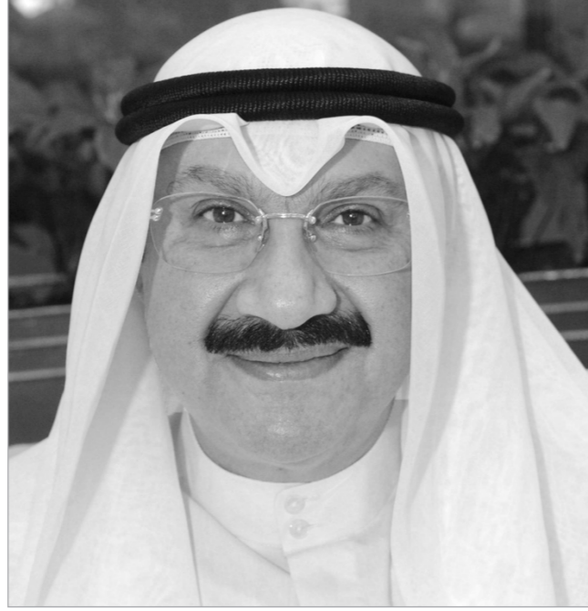
الشيخ سالم عبدالعزيز