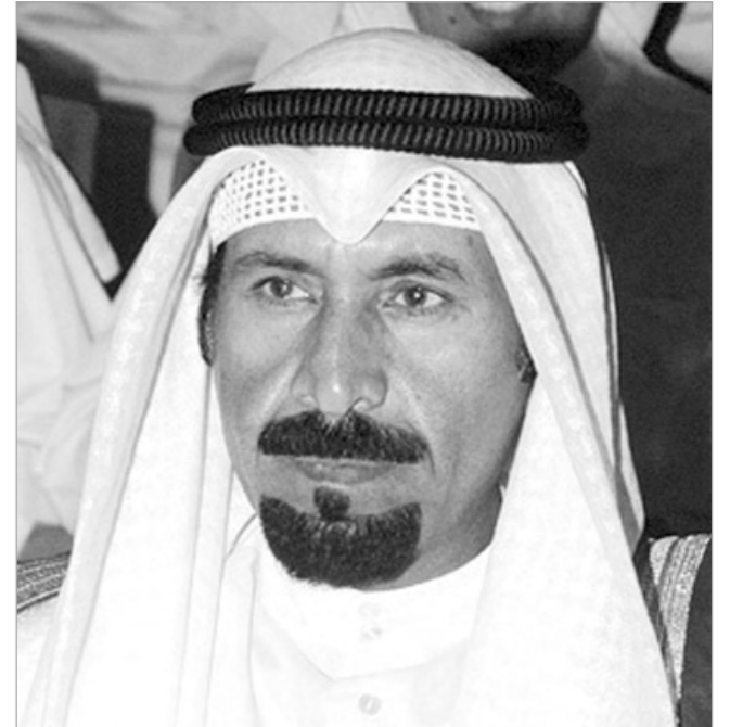
الشيخ علي الجابر

الذي اتبعته وتبعه «الأبناء» في أداء رسالتها بكل حيادية ونزاهة ومصداقية.