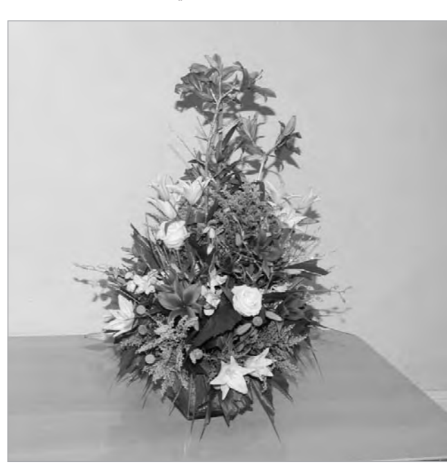
ورود من محافظ العاصمة الشيخ علي الجابر

أن كل صحيفة تقوم بهذا الدور تجعل من الصحافة حبيزة سلطة رابعة لا يقل دورها عن دور سلطات الحكم الأخرى في الدولة الحديثة. ادعو الله العلي القدير ان يوفقكم وكل العاملين في جريدتكم الغراء لمواصلة العمل والجهود التي تحقق لوطننا العزيز وشعبنا الكريم ما نصبو اليه من أمن وأمان واستقرار ورفق وتقدم وازدهار في ظل الرعاية الكريمة والقيادة الحكيمة لسيدي حضرة صاحب