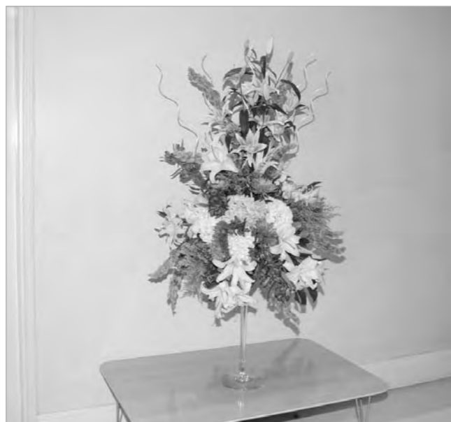
محافظ المركزى الشيخ سالم عبدالعزيز عايد «الأبناء» بالزهور

كما يسرني أن أعرب لكم عن تقديري لجهودكم المخلصة في خدمة القضايا الوطنية لبلدنا العزيز الكويت ومختلف القضايا العربية والإسلامية مع الطرح الجيد لجميع الموضوعات السياسية والاقتصادية والثقافية ومعالجتها بحكمة واقتدار، مما جعل جريدة «الأبناء» تنبؤا مكانة مرموقة في وسائل الإعلام العالمية، متمنيا لكم وجميع العاملين بالجريدة كل توفيق وسداد.