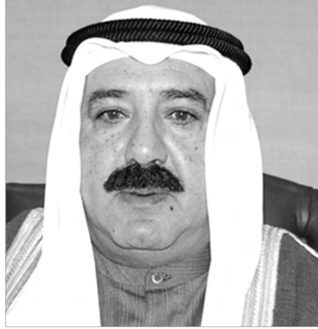
الشيخ ناصر صباح الأحمد