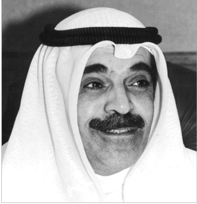
الشيخ فيصل المالك

ناصر صباح الأحمد: نتمن دور «الأبناء» في مسيرة الإعلام والصحافة الكويتية وتوجيه مسيرة التنمية نحو كل ما هو أرقى