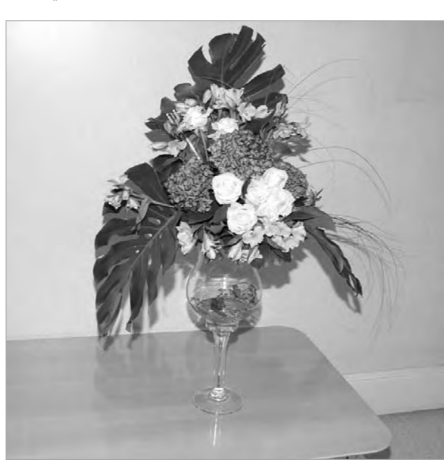
.. وباقة جميلة من وكيل وزارة الإعلام الشيخ فيصل المالك

وبدوره أرسل محافظ العاصمة الشيخ علي الجابر بباقة ورود تعبيراً عن تقديره لـ «الأبناء» متمنيا لها استمرار النجاح والتقدم لما فيه خدمة الوطن والمواطن من خلال النهج الإعلامي البناء