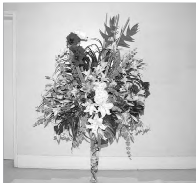
باقة زهور من سمو رئيس الوزراء الشيخ ناصر المحمد

السمو الامير الوالد الشيخ صباح الاحمد الجابر الصباح وسيدي ولي العهد الشيخ نواف الاحمد الجابر الصباح حفظهما الله ورعاهما.