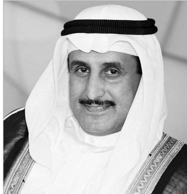
الشيخ إبراهيم الدميح