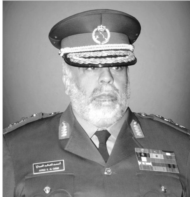
الشيخ أحمد الخالد