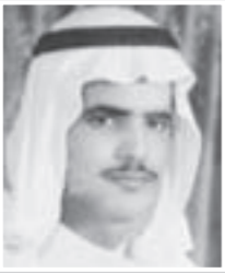
الفريحان في شبابه