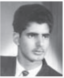
وفي شهادة تخرجه