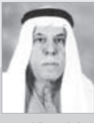
إعداد: منصور الهاجري

"من الماضي" صفحات مضيئة مشرفة نفتحها معكم يوم السبت من كل أسبوع نوثقها لكم بشهادات وأسرار وذكريات كويت الماضي مع رجالها الأوائل الذين عاشوا الفترتين ما قبل النفط وما بعده. نحاول كل أسبوع أن نعيد رسم كويت الماضي مع ضيوفنا ونسير أغوار ذاكرتهم المملوءة ببق الماضي والزمن الجميل. صفحات "من الماضي" ليست أكثر من محاولة لإعادة كتابة الزمن الجميل بالنسبة من عاشوا ذلك الزمان والذين يرددون دوماً "عنتج الصوف ولا جديد البريسم".