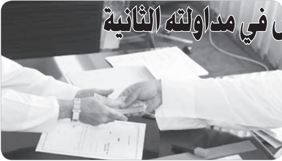
إسقاط فوائد القروض خطوة إلى الوراء

للفتين - استهلاكية ومقسمة - نحو 56% من عدد القروض، لا يخصص سوى 16% من رصيد القروض، بينما تستأثر نسبة 44% من عدد القروض بـ 84% من رصيد القروض. ولو كان الجدل يحكمه منطق، يفترض أن يتوقف الحديث عن مشروع بهذا المستوى من الغبن، ولكن لا يبدو أن المنطق هو ما يحدد معيار القياس.