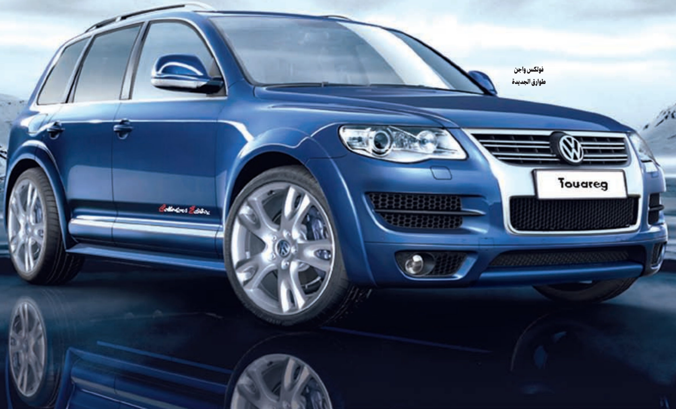
فولكس واجن طوارق الجديدة

كشفت شركة بهيهاني للسيارات مؤخراً عن إصدارها المثير والمحدود من فولكس واجن طوارق التي أطلق عليها اسم Collectors Edition. حيث تستهدف العملاء الذين يبحثون عن سيارات استثنائية من حيث المزايا الرياضية والأناقة والفخامة. وذكرت شركة بهيهاني أن سيارة طوارق تبدو أكثر ديناميكية، بعد تعزيزها بمجموعة التجهيزات الخارجية «Exterior» التي تمنحها مظهراً يسهل التعرف عليه من خلال تعديلات معينة على هيكل السيارة. ومن ضمن الخصائص الجوهرية التي تميز سيارة طوارق المصدات المطلية بلون السيارة والتي تحمل الجزء السفلي منها تصميماً جديداً، بالإضافة إلى «diffuser» الناشر الموصل بالمصد الخلفي وشبك المبرد الأمامي المزود بخطوط مزدوجة مطلية بـ «الكروم». وعند النظر إلى السيارة من الجانب، يعمل كل من قوس العجلات السوداء الكبيرة إلى جانب الخطوط الجانبية التي تحمل لون السيارة على إضفاء لمسات تمنح السيارة تصميماً رائعاً. وإضافة إلى ذلك، فإن العجلات المميزة «Casablanca»، بقطر 20 بوصة وزوائد الكروم المضافة إلى الأبواب تعزز لمسة الأناقة والروح الرياضية لسيارة طوارق. ويظهر الشعار على جانبي السيارة مشيراً إلى مجموعة تجهيزات فئة Collectors Edition الرياضية.