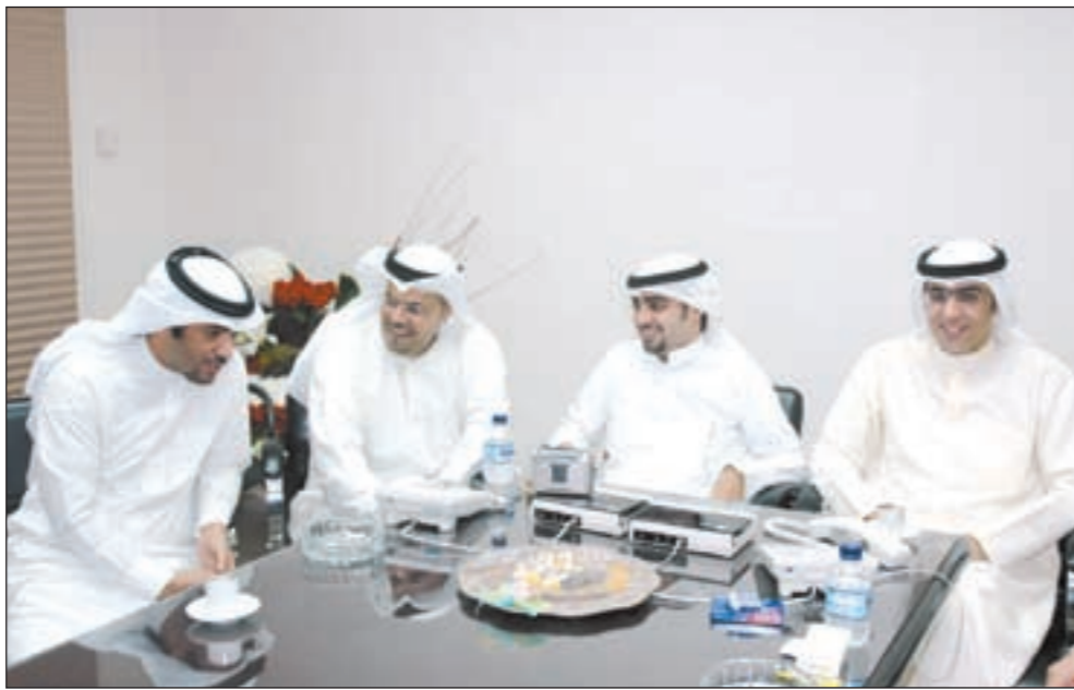
نجوم سكوب يردون على قراء «الأنباء»

نحط عندنا قانون وكذلك قضاء مثل اميركا اللي عنده احتجاج معين يلجأ للقضاء.