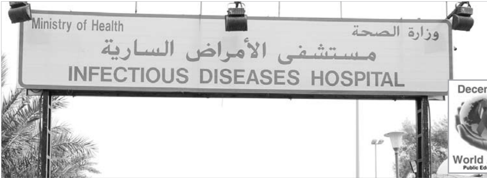
مستشفى الأمراض السارية يتولى علاج المصابين بالإيدز في نطاق سري تام

إعداد قسم الترجمة أعلنت منظمة الصحة الدولية أن المنطقة العربية تواجه حالياً فرصة استثنائية للتصدي لمرض الإيدز. لا يجب تقييدها. جاء ذلك بموقع المنظمة، حيث بينت أن معدلات انتشار المرض ما زالت منخفضة في المنطقة العربية. كما تكشف تقديرات برنامج الأمم المتحدة المشترك لمكافحة الإيدز، عن النسبة في المنطقة العربية والشرق الأوسط عام 2008. موضحة أنها حوالي