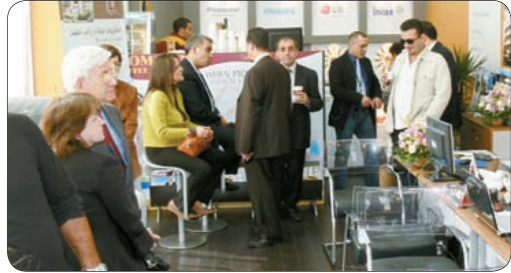
حضور كبير في المقهى