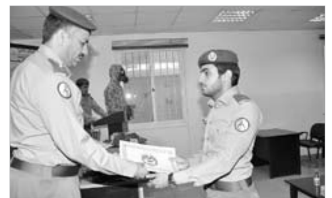
شهادة تقدير لخريج

مفهوم الدفاع الكيميائي وأنواع العمليات المختلفة وطرق تأثيرها وكيفية الوقاية منها. حيث احتوى الشق العملي على كيفية ارتداء مهمات الوقاية الفردية وطرق التطهير بالأجواء الملوثة والاستطلاع والمعابنة والتدريب على دخول غرف الغاز، اما في الجانب النظري فقد تلقى الدارسون في الدورة الاسس الرئيسية حول