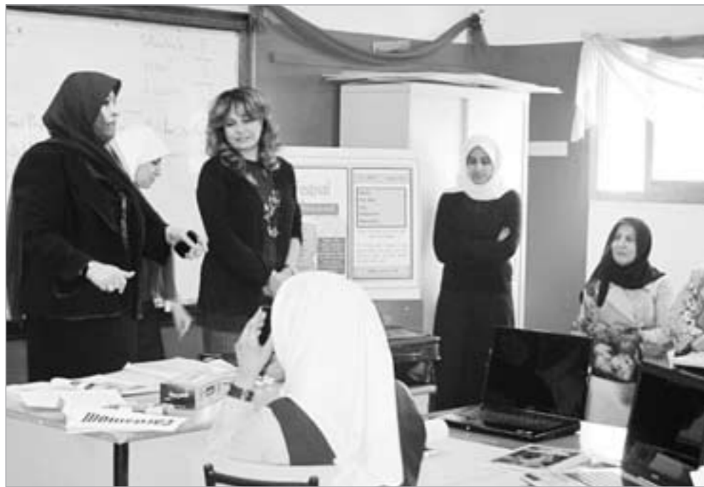
حديث حول مشروع «طالبتي معلمة المستقبل»

◀ الجسار: مراجعة شاملة للنظام التعليمي إحدى أولويات اللجنة التعليمية ▶ دشتي: نقدنا 3 مشاريع للتعليم الإلكتروني و«الذاتي» و«عن بعد»