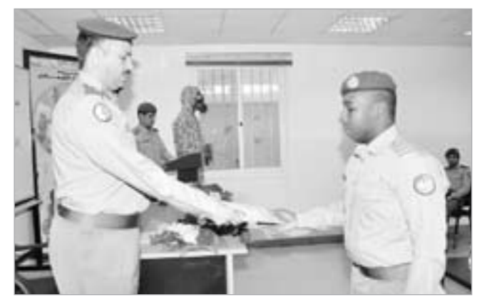
تكريم أحد خريجي الدورة