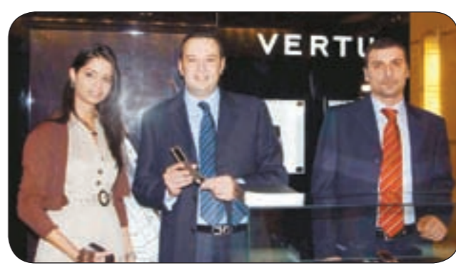
جورني رجال يعرض الهاتف الجديد

أفضل المطاعم، وأحدث المعارض، وديلا للتسوق، ونصائح حول آداب التصرف الثقافية، وبالتالي، تقدم خدمة City Brief معلومات خاصة بمستخدمي هواتف Vertu فتجنّبهم تضيق الوقت بحثاً عن المعلومات التي يحتاجونها. وعن تميز تصميمه، أفاد بان تصميم Vertu Constellation Axyta يظهر خطوطاً واضحة وتفصيل دقيقة تضيء على امتياز تصميم Vertu وتذكر بشكل مجموعة «Vertu V»، مشيراً إلى ان الهاتف يتضمن مفصلاً عالي الهندسة بالإضافة إلى المواد الرائدة التي تستخدمها الشركة كالخزف، الجلد، والشاشة من كريستالات الياقوت، والإطار الفولاذي، والقطع المصنوعة من الالمنيوم الخاص بالطيران. من جانب، علق الرئيس الجديد لشركة Vertu بيرني أوستينغ، قائلاً: يعتبر هاتف Constellation Axyta من Vertu استكمالاً لسعي الشركة وراء تزويد المستهلك الفريد والمميز بمجموعة رائعة من الهواتف المتحركة الفاخرة واكسسواراتها.