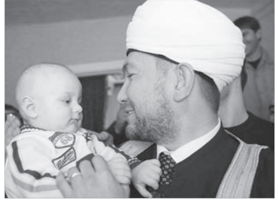
أحد رجال الدين في روسيا يحمل الطفل المعجزة

ويتوافد ما يصل إلى ألفي زائر من مسلمي روسيا البالغ عددهم 20 مليوناً يومياً لرؤية الرضيع اللطيف ذي العينين الزرقاوين والذي بات منزله المبني من الطوب القرنفلي اللون مزاراً. وقال فلاديمير زخاروف نائب مدير مركز أبحاث القوقاز بجامعة موسكو للعلاقات الدولية إنه ليس في وضع الحكم على صحة المزاعم لكن الواضح أنها ولدت من رحم اليأس.