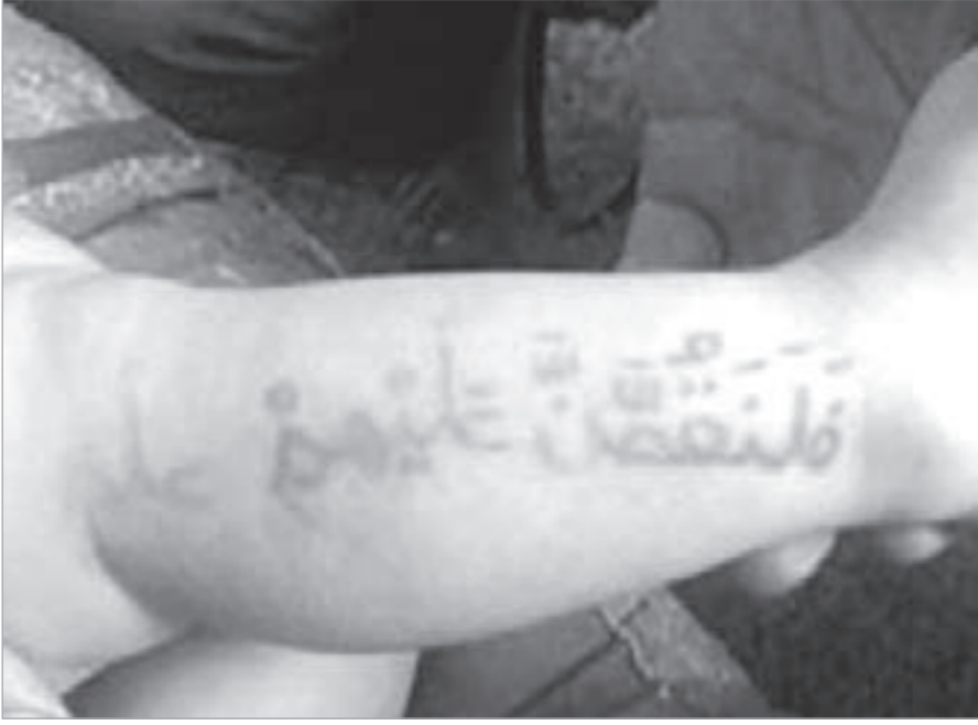
آيات قرآنية على جسد الطفل