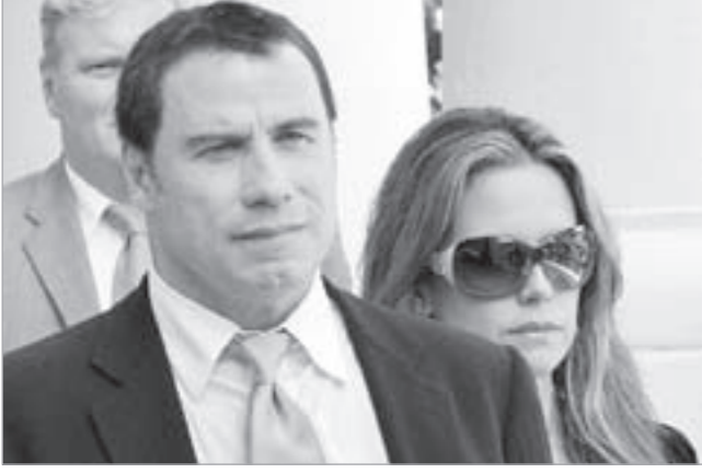
جون ترافولتا وزوجته كيلي بريستون

نأسو - رويترز: أمرت قاضية محكمة عليا في الباهاما بإعادة المحاكمة في قضية تتعلق باتهام شخصين بمحاولة ابتزاز ممثل هوليوود الشهير جون ترافولتا للحصول على مبلغ 25 مليون دولار. وحكمت القاضية أنيتا آلن في وقت متأخر من مساء الأربعاء الماضي بطلان المحاكمة في القضية بعد أن أعلن سياسي في الباهاما قبل الأوان في المؤتمر السنوي لحزبه كانت تجري تغطيته على الهواء من جانب محطات إذاعية وتلفزيونية إنه تمت تبرئة المتهمين، ولم تحدد القاضية موعداً للمحاكمة الجديدة. ووجه الاتهام إلى بيلزانت بريد جووتر التي كانت عضواً في مجلس الشيوخ في الباهاما وإلى تريانو ليتبورن وهو سائق سيارة أسياف بمحاولة