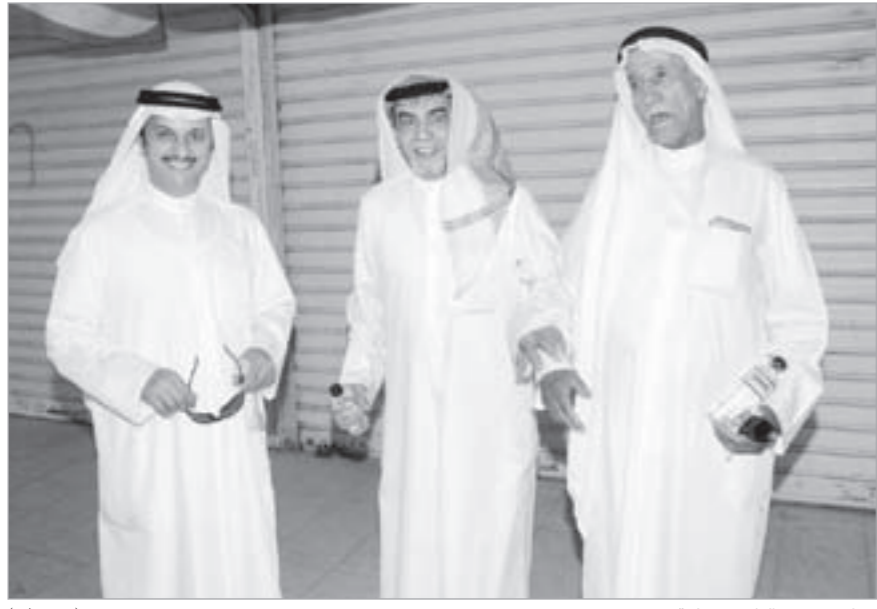
محلات سوق الطيور مغلقة