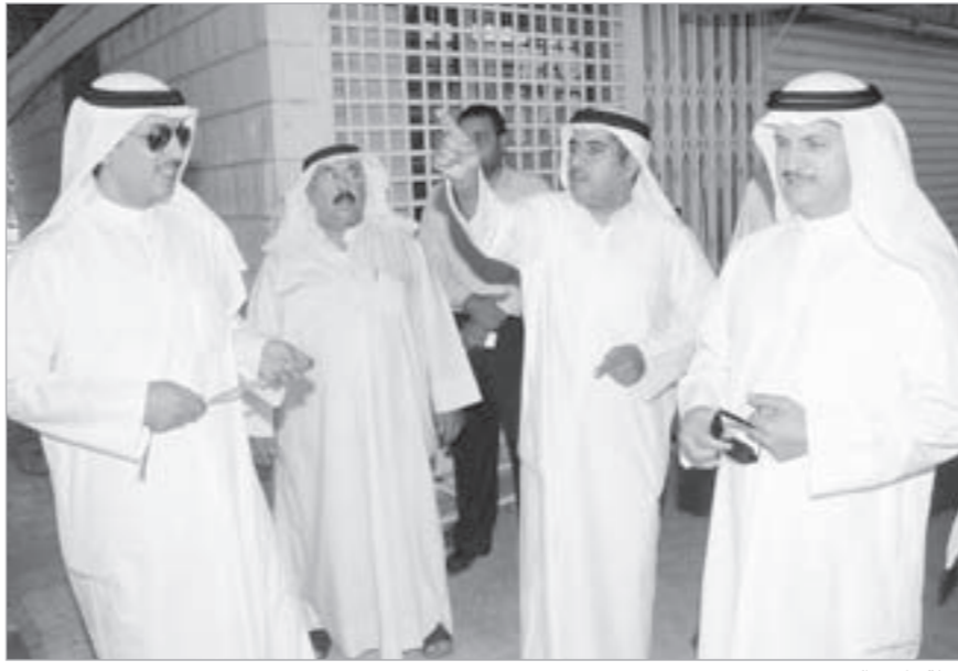
جولة داخل السوق