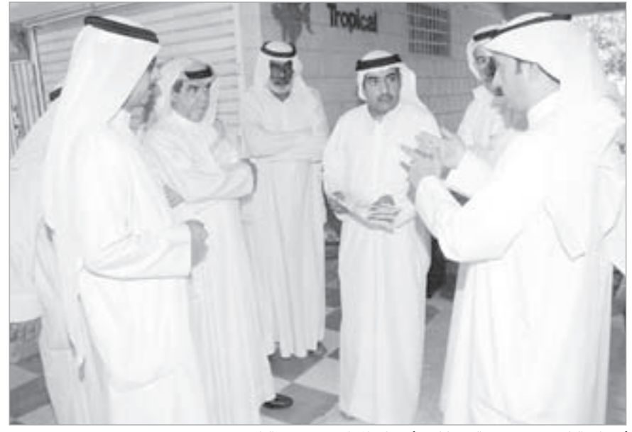
أعضاء "البلدي" يستمعون إلى شكاوى أصحاب المحلات في سوق الطيور