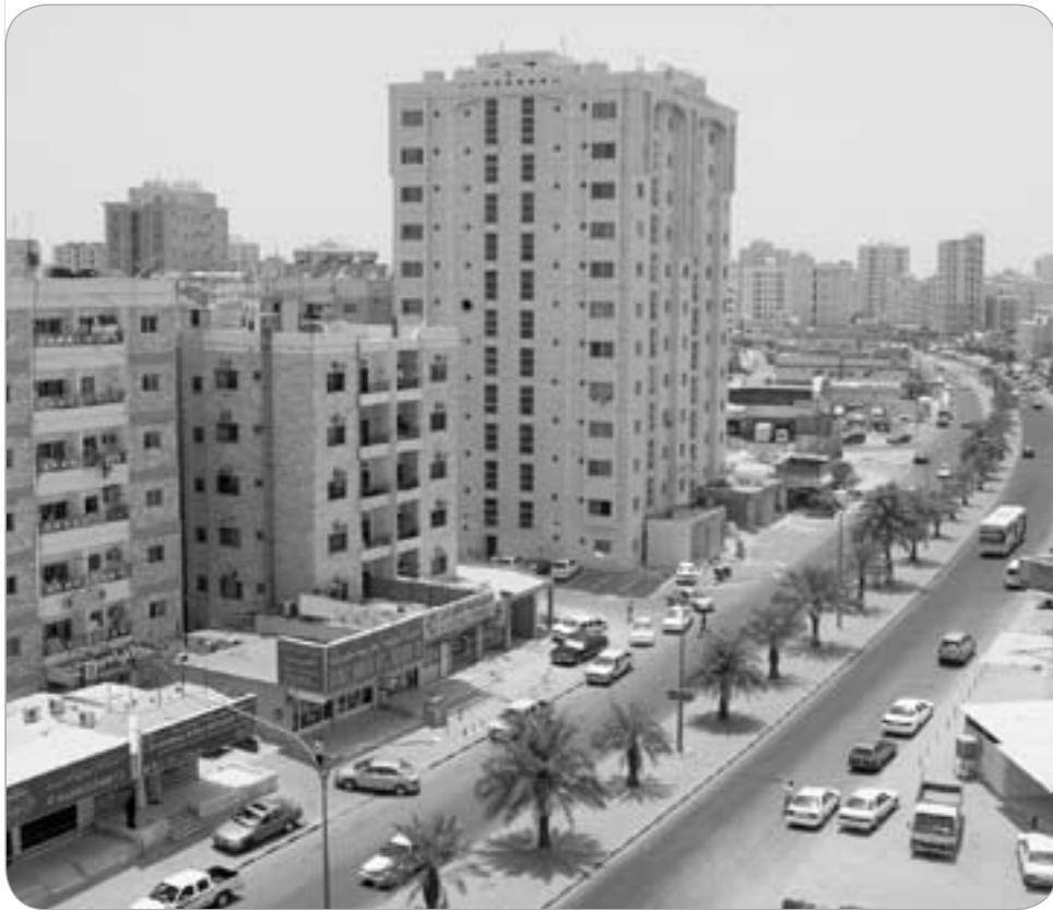
انخفاض سيولة قطاع العقار المحلي خلال الربع الثالث

قال تقرير الشال الاقتصادي الإقليمي إن آخر البيانات المتوافرة من وزارة العدل - إدارة التسجيل العقاري والتوثيق (حتى نهاية سبتمبر 2009)، تشير إلى تراجع ملحوظ في تداولات شهر سبتمبر من العام الحالي مقارنة بميلتها في شهر أغسطس الفائت، وقد قاربت نسبة هذا التراجع 37,2٪. فقد بلغت بيوعات شهر سبتمبر من العام الحالي 70,0 مليون دينار مقارنة بنحو 111,5 مليون دينار في شهر أغسطس الفائت. وأوضح التقرير أن البيانات تشير إلى انخفاض في نشاط السوق العقاري، تمثل بانخفاض في مستوى سيولته، في الربع الثالث من العام الحالي، حيث انخفضت قيمة تداولاته عن مستوى ميلتها في الربع الثاني. إذ بلغت قيمة تداولات العقود والوكالات، الربع الثالث، نحو 339,5 مليون دينار، وهي قيمة أدنى بما نسبته 37,2٪ عما كانت عليه ميلتها في الربع الثاني، منها نحو 256,8 مليون دينار، عقوداً، ونحو