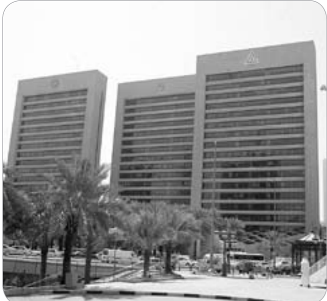
ارتفاع الودائع لدى البنوك بنسبة 1,1٪

أشار التقرير إلى أن النشرة الإحصائية الفصلية (أبريل - يونيو 2009) لبنك الكويت المركزي والمنشورة على موقعه على الإنترنت ذكرت بعض المؤشرات الاقتصادية والنقدية، التي تستحق تطوراتها متابعة وتوثيقاً، ومن ذلك ملاحظة إجمالي عدد السكان في الكويت قد بلغ في نهاية النصف الأول من العام الحالي نحو 3,4429 ملايين نسمة وهو رقم يزيد بنحو 1,1 ألف نسمة، تقريباً عن الرقم الذي سجله تعداد نهاية العام الفائت ما يعني أن معدل النمو نصف السنوي لعدد السكان قد سجل نسبة 0,03٪. وأوضح التقرير أن من هذه المؤشرات أيضاً تحقيق الميزان التجاري - صادرات سلعية ناقصة وإيرادات سلعية - فائض الثاني من العام الحالي، فائض بلغ نحو 2242,9 مليون دينار بارتفاع ملحوظ بلغ نحو 75,9٪ عن مستوى فائض الربع الأول من العام الحالي، نتيجة لارتفاع أسعار النفط وبلغت قيمة صادرات الكويت السلعية خلال هذا الربع نحو 3469,9 مليون دينار، نحو 92,5٪ منها صادرات نفطية، بينما بلغت قيمة وارداتها السلعية - لا تشمل العسكرية - نحو 1227,0 مليون دينار، كما أشارت إلى أن المعدل الموسوم للفائدة على الودائع قد واصل انخفاضه إلى