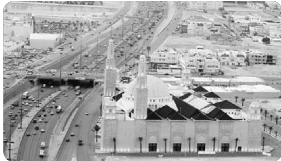
السعودية على رأس الدول العربية المضيفة للاستثمار