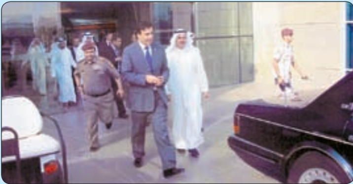
الرئيس ميخائيل مغادرا الأفيوز