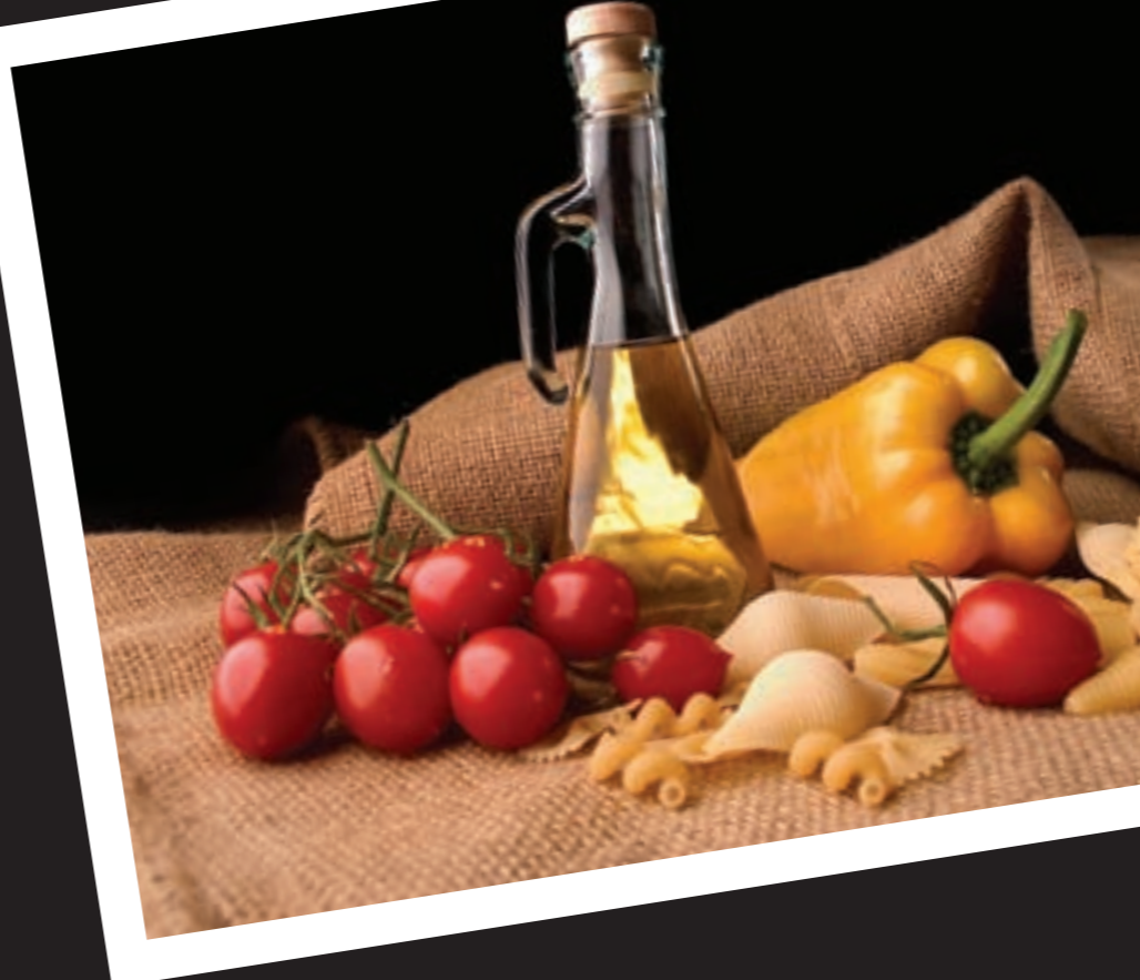
مذاق إيطاليا الحقيقي