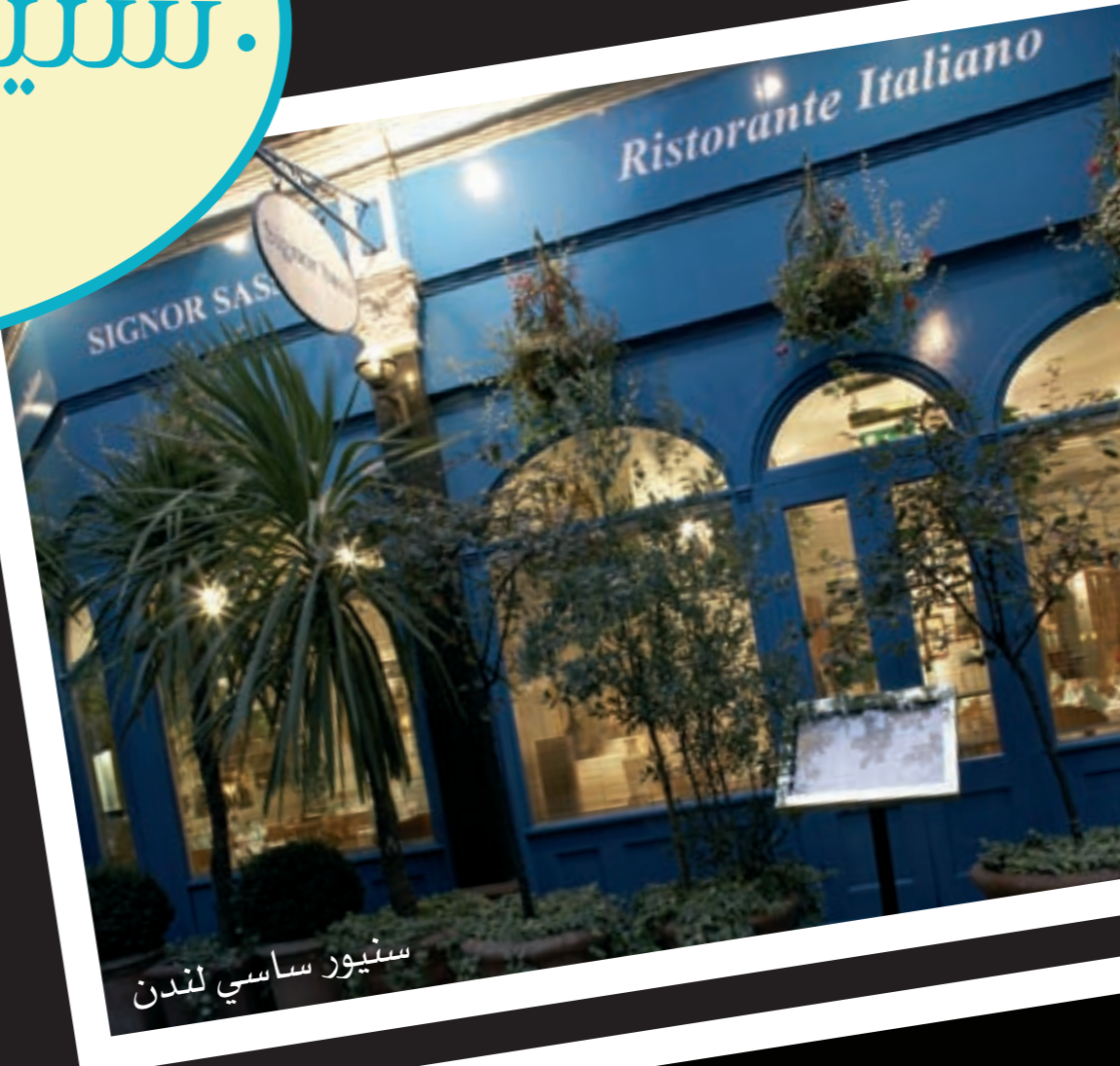
سنينور ساسي لندن