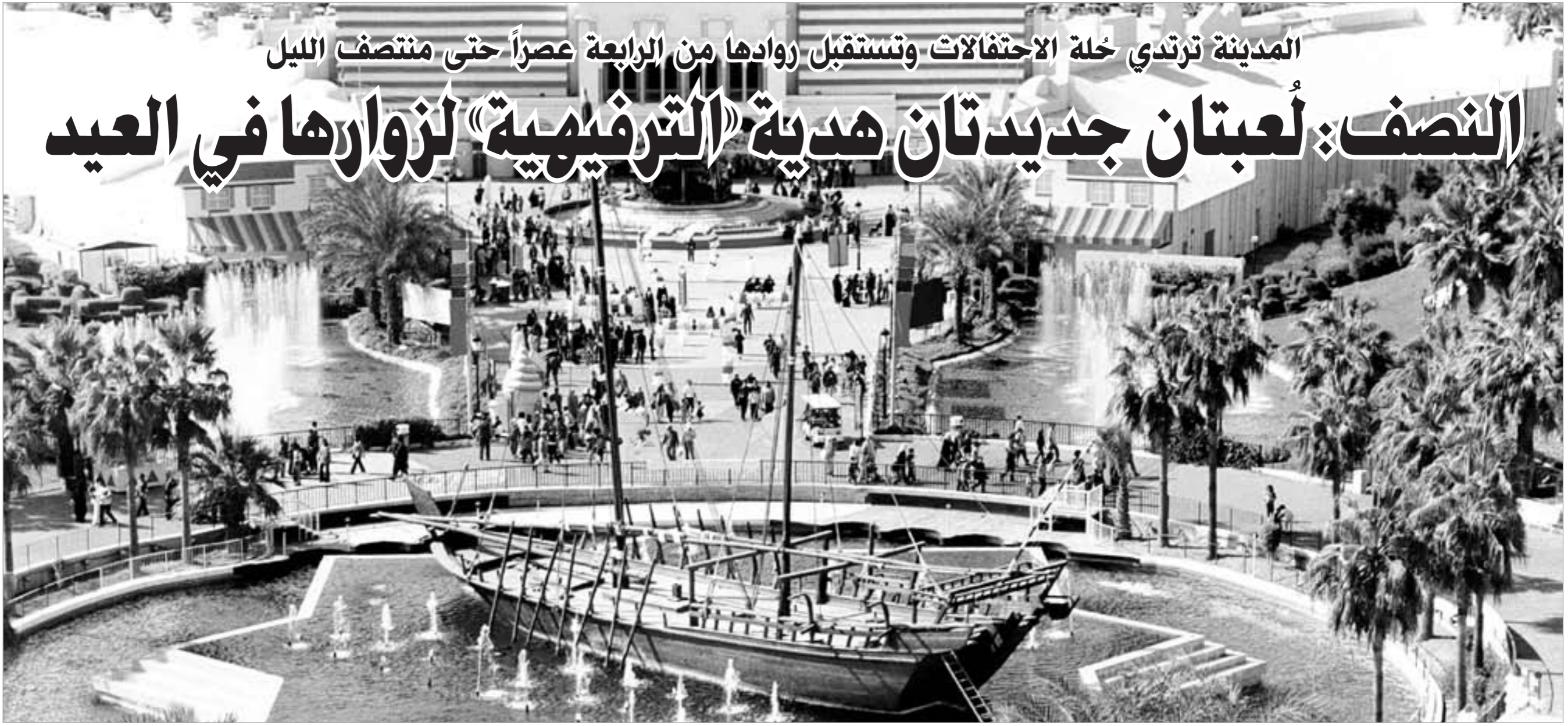
المدينة الترفيهية ارتدت حلة الاحتفالات لاستقبال روادها خلال العيد

المدينة ترتدي حلة الاحتفالات وتستقبل روادها من الرابعة عصراً حتى منتصف الليل