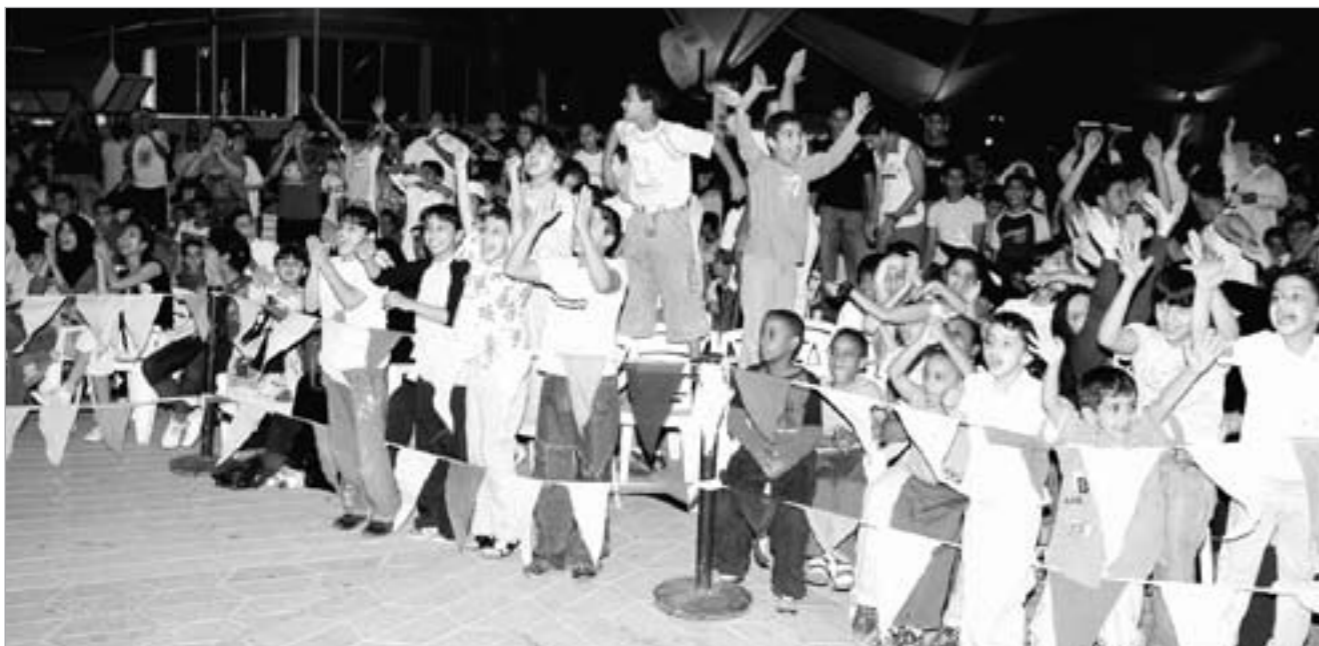
مشاركة من الأطفال في الفقرات المتنوعة