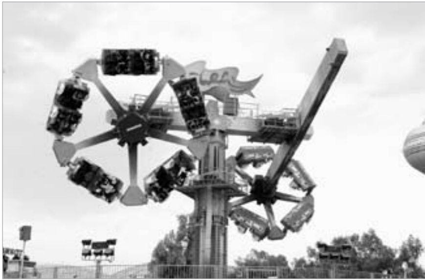
من الألعاب المثيرة

وعن جديد المدينة الترفيهية يقول النصف إن الإدارة تعمل الآن على استخدام ألعاب جديدة حديثة ومتطورة تواكب القفزات النوعية في مجال الترفيه وسيعلم عنها في القريب العاجل، وتمنى النصف أن يستمتع زوار المدينة الترفيهية بفرحة العيد التي لمساتها على وجوه الزوار كباراً وصغاراً.