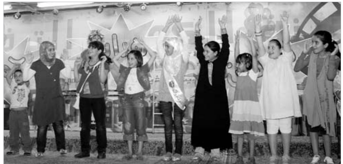
فقرات ترفيهية للبنات