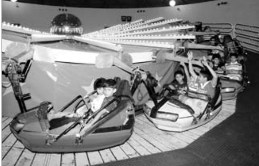
وناسة الأطفال والكبار