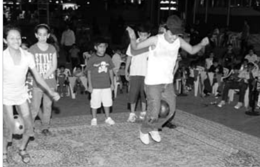
مسابقات ممتعة وجوائز قيمة