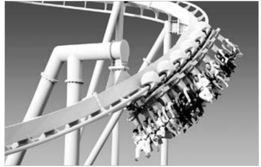
لعبة البرق إحدى الألعاب الرئيسية في المدينة الترفيهية