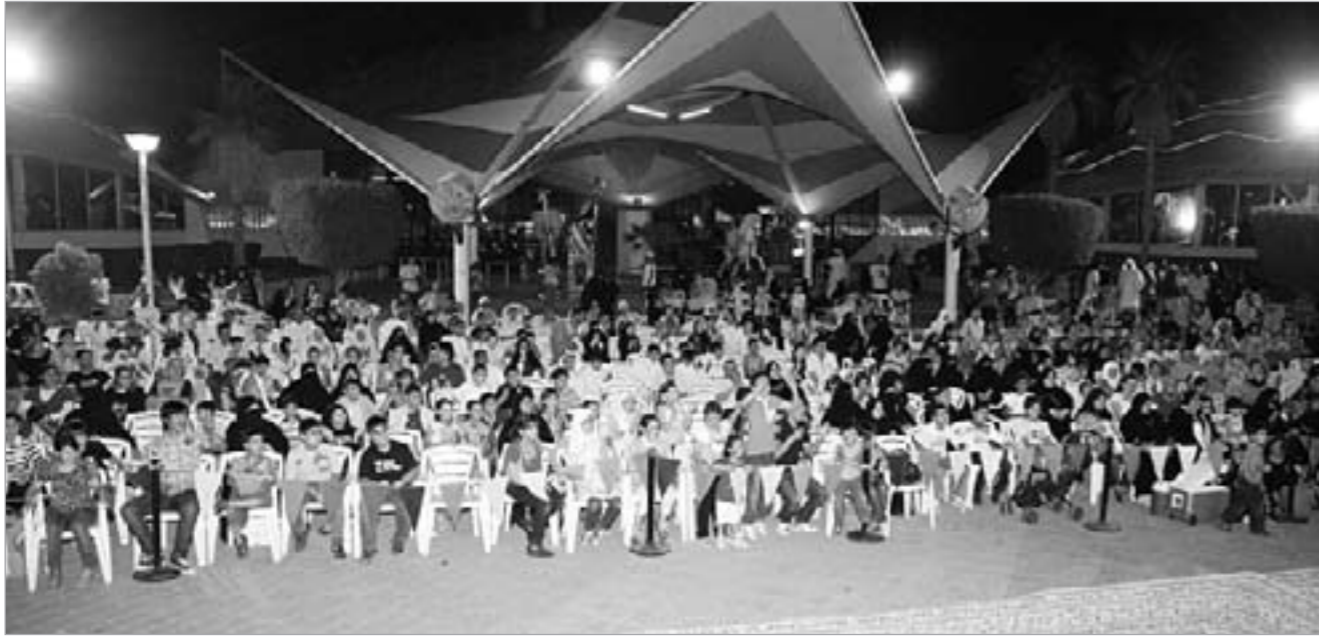
جمهور غفير يتابع أنشطة المدينة