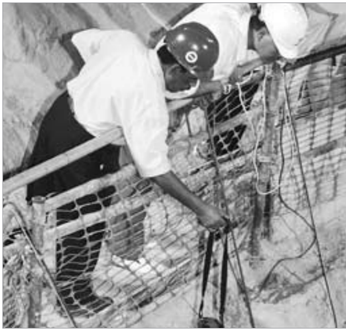
متابعة لعملية إغلاق المنهول «6»

محاوالت لتوسعة عمق المنهول «6» بالكامل بقطر 4 أمتار في خطوة طارئة للدفاع عن المحطة