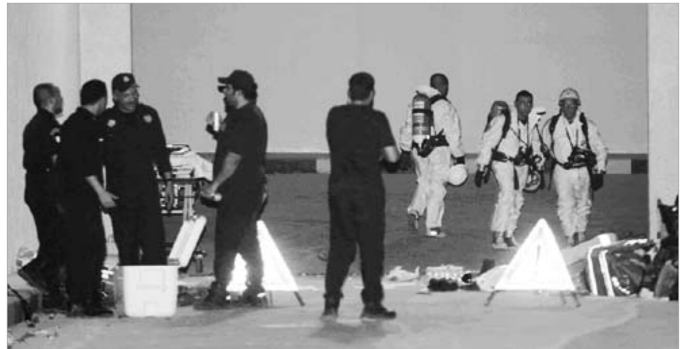
فريق الغوص يستعد للنزول إلى المنهول لقياس نسبة الغازات