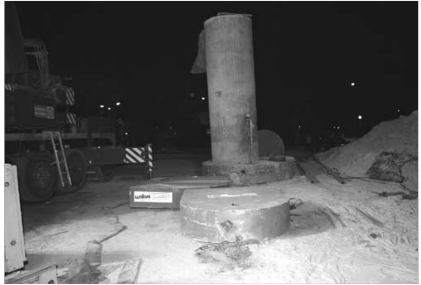
السداة البولي كريت جاهزة للإنزال

أكد وضع سدة بولي كريت وإغلاق المنهول «6» بإحكام