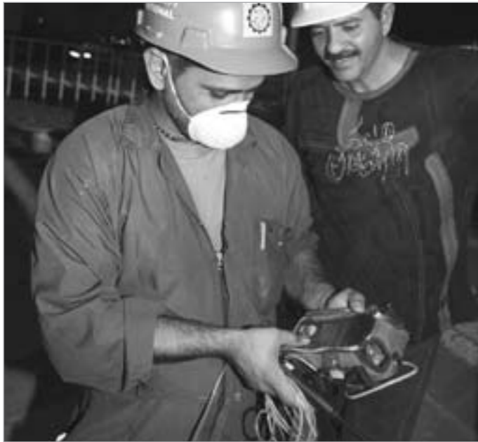
أليات يستخدمها المهندسون لإنجاز المهمة