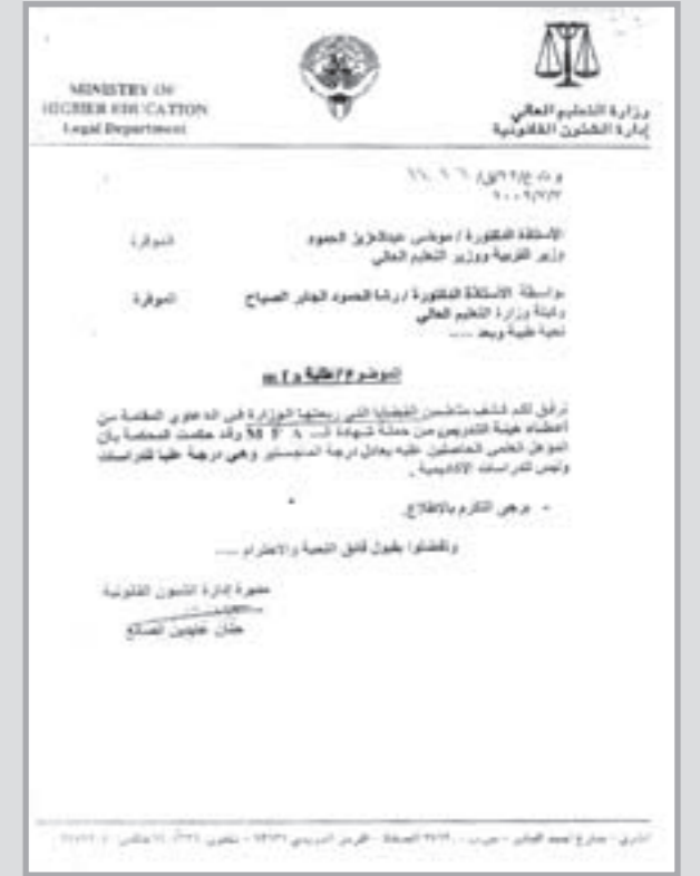
صورة من كتاب الشؤون القانونية