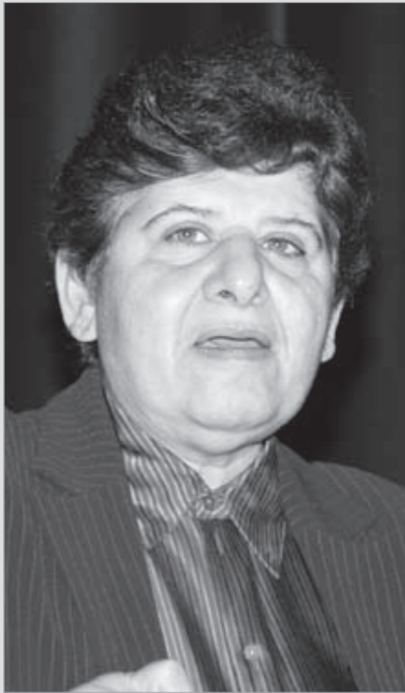
وكيلة وزارة التعليم العالي درشا الصباح