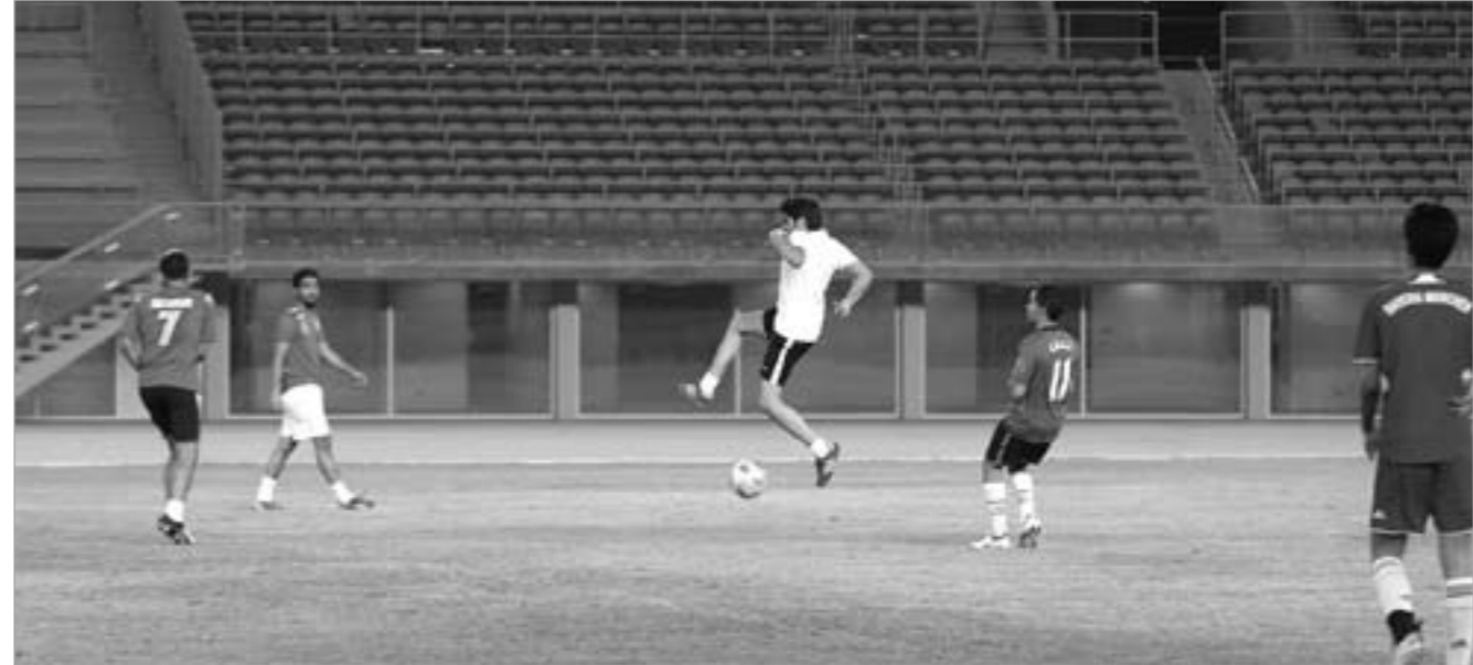
صراع قوي على الكرة بين لاعبي الفريقين

التربية عروض فنية. والافتات للنظر هو تضارب آراء مسؤولي الهيئة حول الموعد المقرر لافتتاح الستاد رسمياً فمنهم من ذكر أن هناك برنامجاً متكاملًا لافتتاح يتزامن مع احتفالات الكويت بعباها