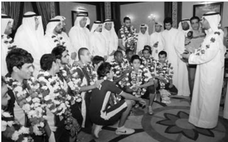
وقد منتخب الشباب للطائرة عند وصوله المطار