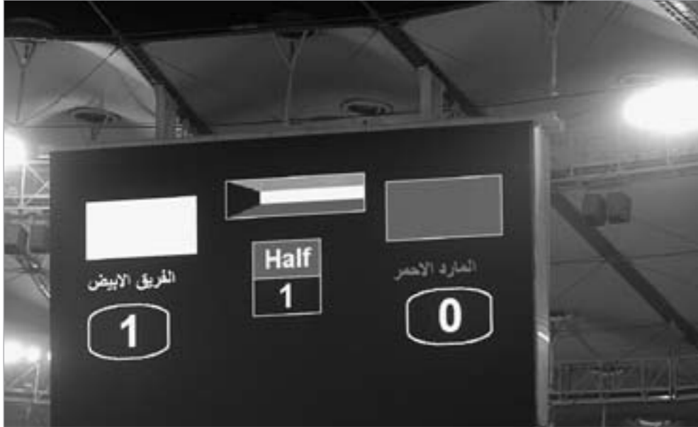
اللوح الإلكترونية تشير لتقدم الفريق الأبيض على المارد الأحمر بهدف (مصابير)

لكن ايا منهم لم يذكر ان من ضمن الخطط المعدة لافتتاح هو لقاء السحاب بين المارد الأحمر والفريق الأبيض ولا نعلم ما عدم الاستواء في بعض جوانبها القرار والمنظّم لها والذي لم يغفل ان يستعين بحكام من اتحاد القدم لتكتمل البروفة. تم منع مصور «الأخبار» من الدخول عبر البوابة الرسمية بحجة عدم وجود احد داخل الستاد الا انه بوسيلة من الوسائل تمكن من تصوير اللقاء انجازاً مهمته.