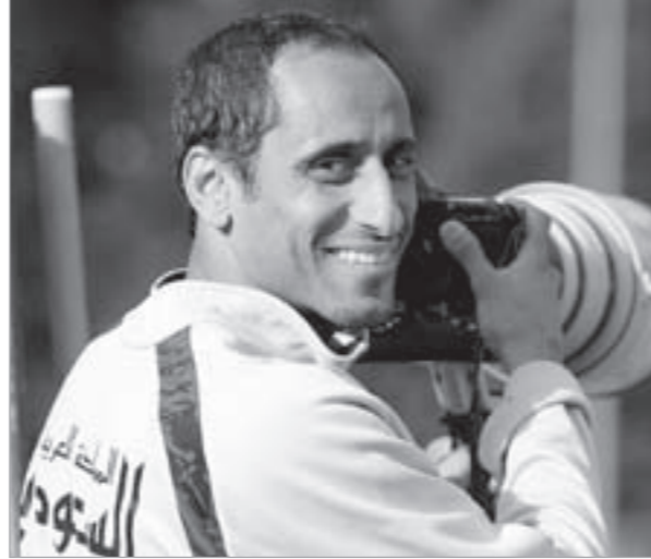
سامي الجابر

غير أن الأطباء لا يرون جدوى من هذه الخراطيم باعتبارها لا تقي من المرض، المنظمة».