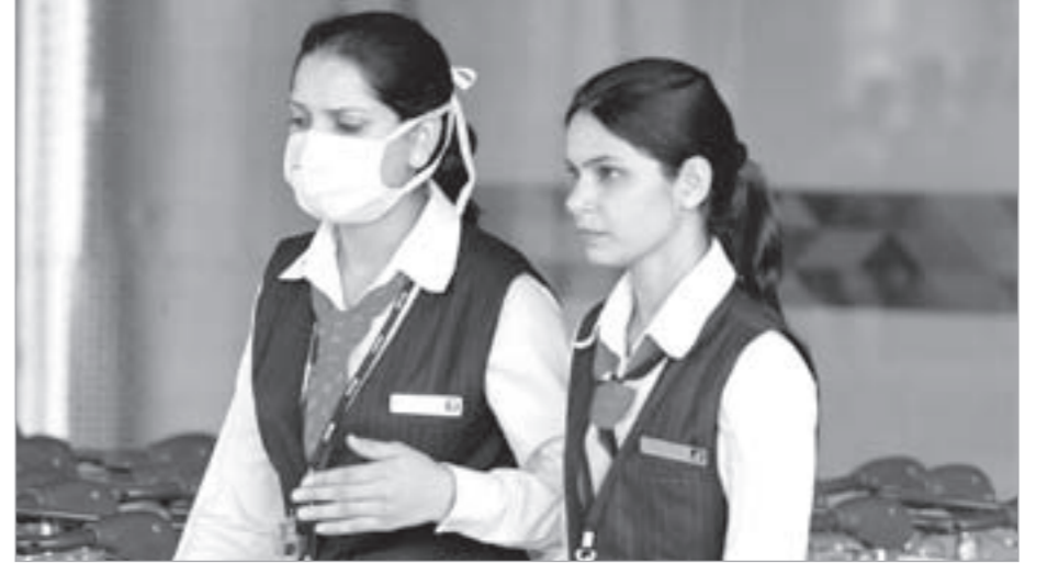
اندونيسيا تشدد اجراءاتها في المطارات بعد تسجيلها حالة الوفاة الرابعة بانفلونزا الخنازير امس

وأوضح هارتل أن المنظمة ترى أن تمديد فترة صلاحية الأدوية هو قضية السلطات التنظيمية الوطنية قائلاً: «في الواقع إذا سمحت السلطات السويسرية كما فعلت الوكالة بتمديد فترة صلاحية الأدوية فإن ذلك يتوافق تماماً مع نظرة المنظمة».