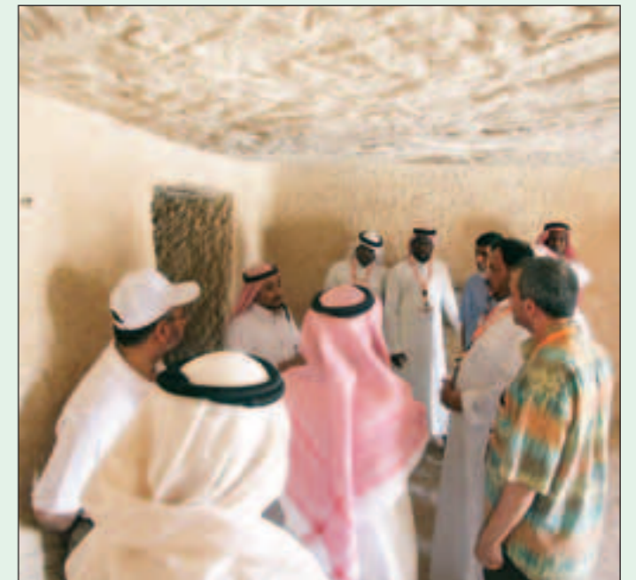
وقد القافلة في ديوان أثري بمدائن صالح

خمس عشر يوماً ما بين الرياض والمدينة المنورة وابها والباحة والطائف ومكة المكرمة وجدة، ومرورا بمدن أخرى وقرى في أعماق الجبال، تشكلت رحلة شائقة بكل ما تحمله الكلمة من معنى، وتستحق التفصيل الواجب في هذه الحلقات.