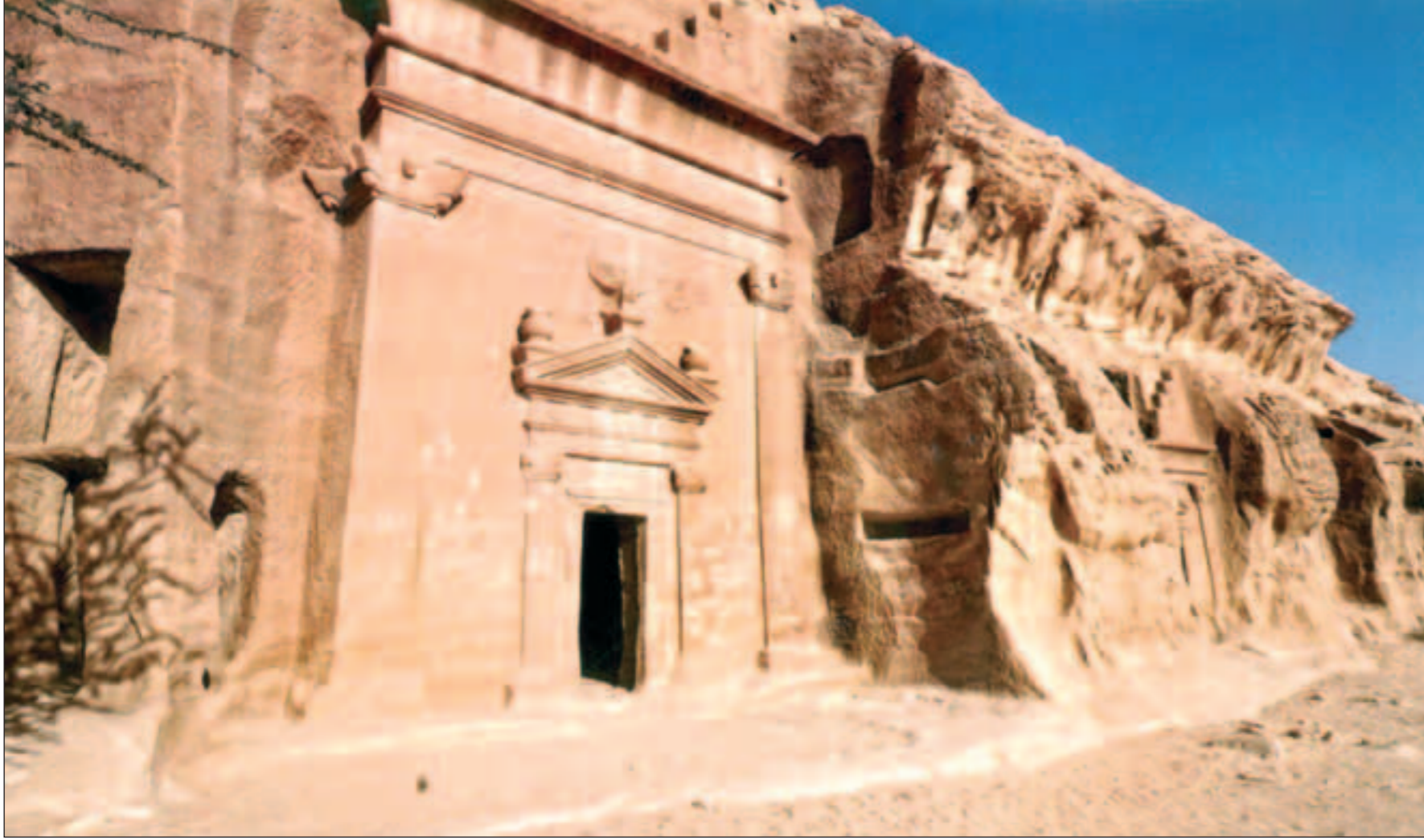
مدائن صالح أحد المعالم الأثرية المهمة في العالم

◀ مدائن صالح معلم أثري بديع أدرج على قائمة اليونسكو وهيئة الآثار تنفذ مشروعاً طموحاً لجعلها مزاراً سياحياً عالمياً وتستقطب الباحثين والمكتشفين للمساهمة في ترميمها