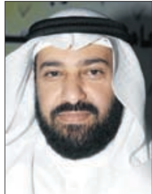
د. علي العمير

مقدمي طلب تشكيل لجنة التحقيق في محاور استجواب وزير الداخلية والتي هدفها استيضاح الحقائق. مبيناً ان النواب كانوا لا يمتلكون الحقائق كاملة أثناء جلسة طرح الثقة فبعضهم أبى ان يظلم الوزير بإعداده سياسياً والبعض الآخر أراد إعدامه سياسياً في ظل النزح اليسير من المعلومات، مؤكداً في الوقت نفسه انه لا يمكن لأحد كشف الحقائق كاملة إلا من خلال