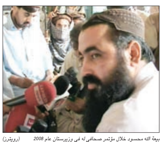
بيعة الله محسود خلال مؤتمر صحفي في لاهور، باكستان عام 2008

عواصم - وكالات: أعلن قيادي في حركة طالبان الباكستانية ان زعيمها بيعة الله محسود قتل في الغارة الجوية الأميركية التي شنتها طائرة دون طيار الأربعاء الماضي على منزل والد زوجته في مقاطعة وزيرستان الجنوبية. وقال القيادي الذي طلب عدم الكشف عن اسمه ان المجلس الاستشاري للحركة عقد اجتماعاً في ساراروجا لاختيار خليفة لمحسود. كذلك أكد مسؤولون باكستانيون مقتل محسود في الغارة الأميركية إلا ان البيت الأبيض كان أكثر حذراً إذ قال المتحدث باسمه روبرت غيبس للصحافيين «رأينا التقارير عن مقتل محسود. لا يمكننا تأكيد موته». وأضاف «يبدو ان هناك اتفاقاً متزايداً بين مراقبين ذوي مصداقية على انه مات فعلاً». ومحسود ملاحق من قبل واشنطن وإسلام آباد اللتين اتهمانه بالمسؤولية عن العديد من التفجيرات في باكستان بينها التفجير الذي اغتيلت فيه رئيسة الوزراء الباكستانية السابقة بينظير بوتو. التفاصيل ص18