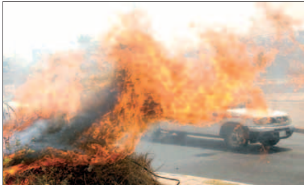
السنة نيران الأشجار تكاد تلامس السيارات المارة بالطريق