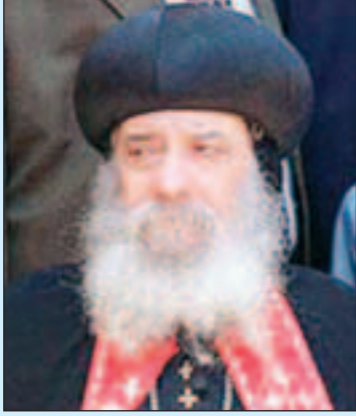
البابا شنودة الثالث

أيضا بانفلونزا الخنازير توفيت في مستشفى شنابر للأطفال في بيت تكفا الليلة الماضية. وكانت الطفلة قد أدخلت إلى المستشفى قبل حوالي أسبوعين اثر إصابتها بانفلونزا الخنازير ثم غادرت عائدة إلى منزلها بعد تحسن حالتها ولكنها انهارت يوم الثلاثاء في منزلها نتيجة إصابتها بسكتة قلبية فأدخلت مجددا إلى المستشفى حيث فارقت الحياة.