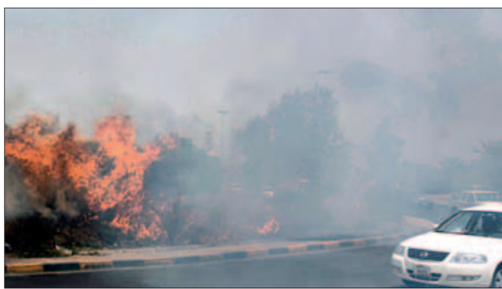
والدخان غطى الطريق

في الوقت الذي استبعد مصدر في الإدارة العامة للإطفاء ان تكون درجة الحرارة هي التي تسببت في اندلاع النيران في شارع الصحافة مرجحاً ان يكون الحريق عمدا الا ان شاهد عيان استبعد ان يكون عقب سيجارة مشتعلة وراء الحريق وان اشعة الشمس الحارقة هي التي تسببت في احتراق الأشجار بحسب مصدر اطفائي. وكان المارة شاهدا النيران تتدافع من عدد من الأشجار وابلغوا عمليات وزارة الداخلية التي بدورها أخطرت مركز اطفاء الشيوخ الذي سارع رجاله لاختماد النيران.