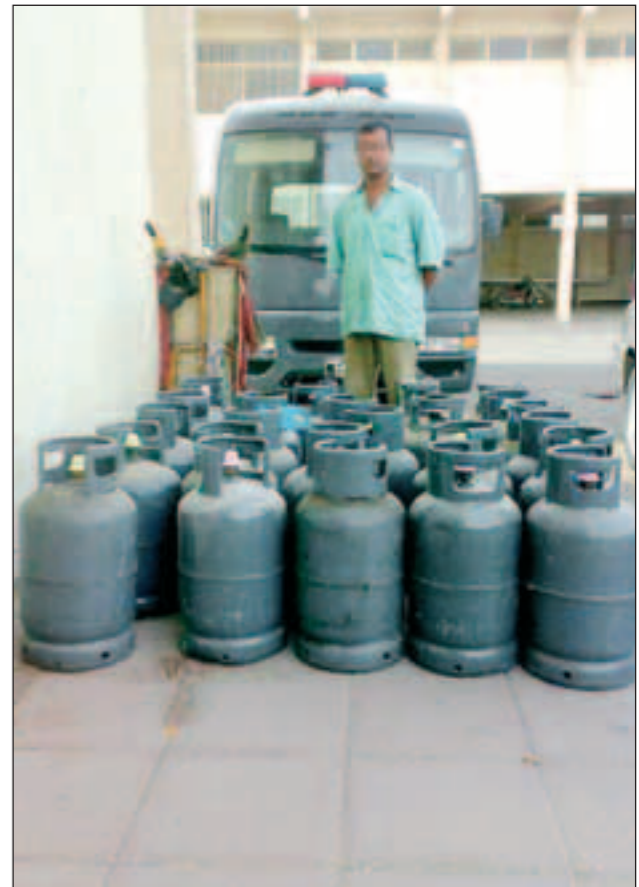
الآسيوي وأمامه سلندرات الغاز المضبوطة

هاني الظفيري المتعارف عليه في ضبليات رجال أمن الفروانية هو توقيف لصوص حديد أو نحاس ولكن المختلف ان يتم توقيف لص سلندرات، وهذا هو ما حدث حينما جرى توقيف آسيوي مستقل سيارة هاف لوري ومعه 24 سلندر غاز. وقال مصدر امني ان رجال أمن الفروانية أوقفوا الآسيوي واستغربوا من حيازته لهذا الكم من السلندرات وبالتحديد معه اعترف بأنه يسرق السلندرات من أمام البقالات وكذلك التي يتركها السكان مقابل شفقهم ومن ثم يبيع الواحدة في سكراب أشغرة بدينارين، وتمت إحالته إلى المباحث الجنائية لمعرفة سجله الجنائي.