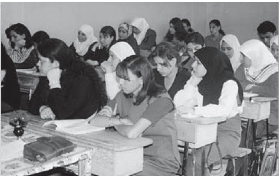
طلاب الثانوية العامة لهم حق الاعتراض على النتائج بشرط

الأصول مع قوائم أسماء الطلاب المعترضين بعد تسجيل الدرجات إليها ليقيم مركز التصحيح بإرسال الأوراق التي وقع فيها خطأ مادي فور اكتشاف الخطأ إلى مديريات الامتحانات للمعالجة. وحظرت الوزارة تسليم المعاملات باليد وتوجيه الطلاب إلى مراكز التصحيح والرد على المعاملات التي ترد بصورة غير نظامية وإطلاع الطلاب أو ذويهم على أوراق إجاباتهم وإعطائهم درجاتهم من الورق مباشرة مؤكدة على العاملين المكلفين أعمال الامتحانات العامة توخي الدقة والسرية التامتين أثناء العمل.