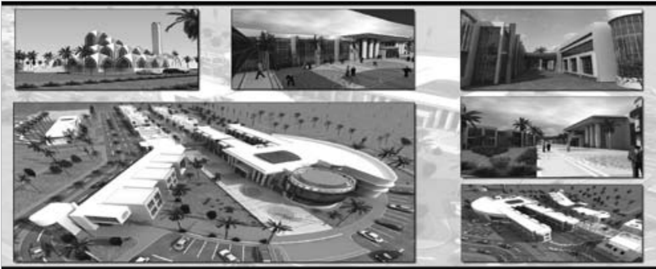
تصاميم إنشائية لمجمع الخدمات الزراعية