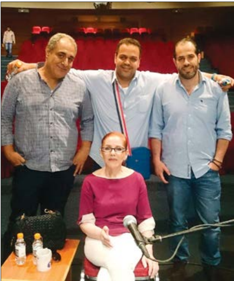
ميادة الحناوي وبهاء حسني في برقيات الحفل

أقيم هذا العام مهرجان مدينة الفحيص في المملكة الأردنية الهاشمية في دورته الـ 26 بافتتاح كبير مع أكبر وأجمل وأعظم الفنانين المصريين والعرب وعلى رأسهم الفنانة السورية الكبيرة ميادة الحناوي وأمير الغناء العربي الفنان الكبير هاني شاكر، وسلطان الطرب الفنان الكبير جورج وسوف والفنان عاصي الحلاني والفنان احمد شبيب وحسين الديك وباقة من ألمع وأجمل الفنانين والمطربين الأردنيين تحت إدارة وإشراف الفنان بهاء حسني.