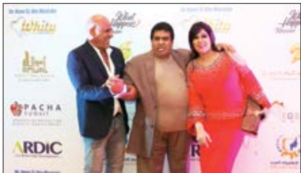
فيفي عبده واحمد عدوية ومحمد لطفي في حفل النخبة

شهدت قاعة المؤتمرات بمدينة نصر الدورة الثانية من مهرجان النخبة للإعلام العربي، وحضر التكريم عدد كبير من نجوم السباق الرمضاني الماضي، ومن بين المكرمين حمادة هلال وإدوارد ومصطفى أبو سريع عن مسلسل «طاقة القدر»، واحمد صيام ومحمد لطفي ووائل عبدالعزيز عن مسلسل «كلبش»، وانجي أباطة وحسن شستا عن مسلسل «الآب الروحي»، والفنانة الاستعراضية دينا عن مسلسل «الحرباية»، ومحمد فهيم عن مسلسل «الجماعة» الجزء الثاني، وحصل كل من فيفي عبده، واحمد التهامي واحمد عدوية منها أبو عوف وإيناس مكى وشريف إسماعيل والمطربة ايناس عز الدين والمطربة مروة ناجي واحمد التهامي واحمد وفيق وحجاج عبدالعظيم وشذى ومنى ممدوح ومحمد نجاتي ومحمود فارس وأميرة نايف