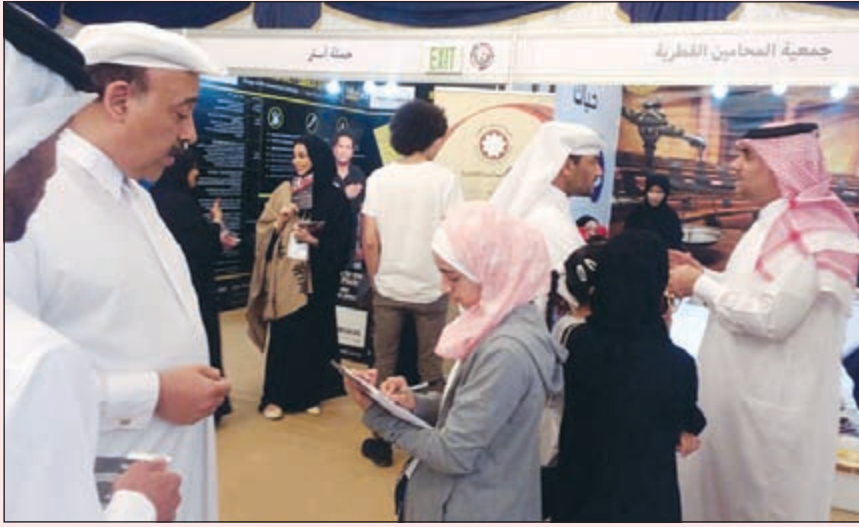
في فعاليات المرور في درب الساعي