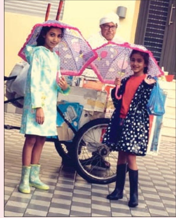
الأجواء حارة والمثلجات تبرد الحرارة