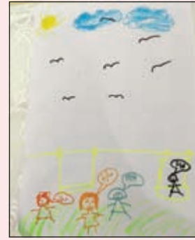
ترسم وتشارك الصديقات باللعب