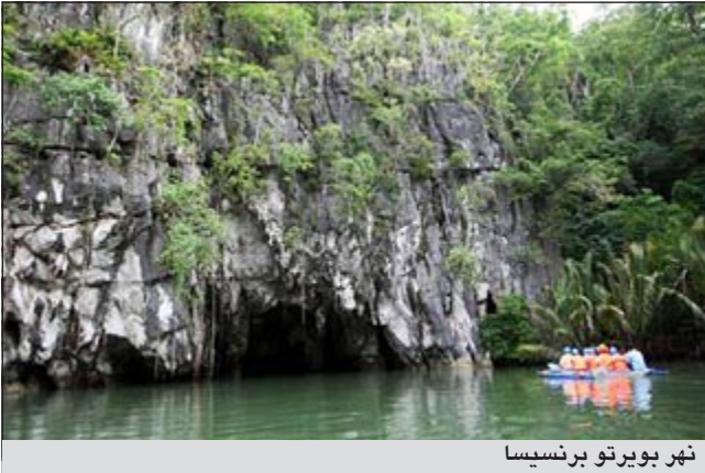
نهر بويرتو برنيسيا

طوكيو - أ.ش.أ: كشفت شركة «توشيبا» اليابانية، عملاق صناعة الإلكترونيات في العالم، عن بعض التفاصيل الخاصة بحاسبها اللوحي المقبل، الذي أطلقت عليه رسميا اسم «ثرايف». وتامل الشركة في أن ينافس الحاسب اللوحي الجديد بشكل خاص الحاسب الشهير «آي باد 2»، على الرغم من أنه أقل سعرا. ويبدو أن «توشيبا» متحمسة لإطلاق حاسبها اللوحي الجديد في الأسواق، ولم تنتظر حتى إطلاق معالج «إنيفيديا» الجديد رياعي النواة، ذي الاسم الرمزي «كال إل»، وقررت استخدام معالج «تيجرا 2» ثنائي النواة.