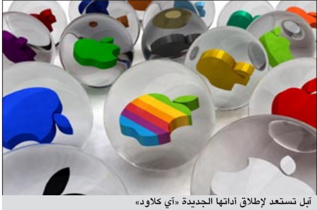
آبل تستعد لإطلاق أدااتها الجديدة «آي كلاود»