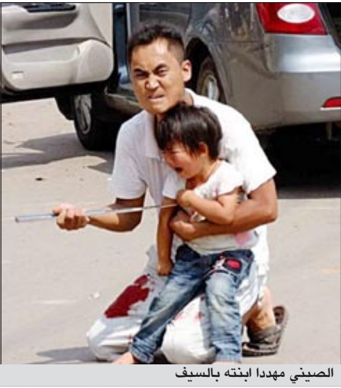
الصيني مهدد ابنته بالسيف

استطاعت الشرطة في الصين السيطرة على رجل اجتاحته نوبة غضب وهدد بقتل ابنته بالسيف اذا لم تسمح له الشرطة بمواصلة السير، الرجل كان تسبب في حادث سير وبدلا من التوقف هرب بسيارته لكن الشرطة حاصرته وطلبت منه التوقف فقام بانزال ابنته وهدد بقتلها.