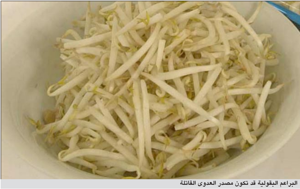
البراعم البقولية قد تكون مصدر العدوى القاتلة

مخضبات على الإطلاق، كما لا توجد أسمدة حيوانية أيضا مستخدمة في أماكن أخرى من المزرعة». إلى ذلك أصدر المكتب الإقليمي لمنظمة الصحة العالمية لإقليم شرق المتوسط ومقره القاهرة فيربيك للصحية «لا أقهم كيف يمكن أن تتفق العملية الجارية هنا (في المزرعة) والاتهامات، مستنبتات السلطة هي نتاج بقول ومياه ولم تستخدم معها