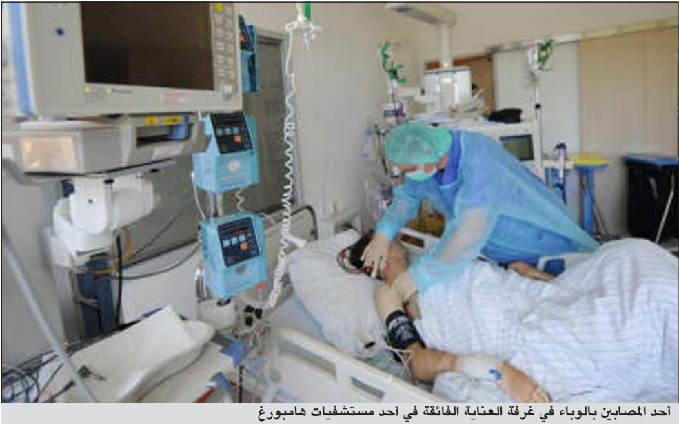
أحد المصابين بالوباء في غرفة العناية الفائقة في أحد مستشفيات هامبورغ