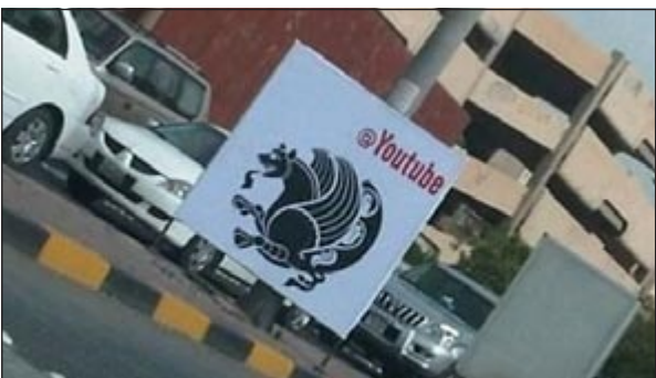
الاعلان الغريب كما بدا في شوارع الكويت

قامت وزارة الداخلية بالتعاون مع بلدية الكويت صباح امس بإزالة لوحات اعلانية وضعت عليها صورة