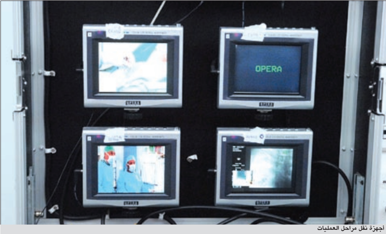
أجهزة نقل مراحل العمليات

وتعقيدا منها، لاننا ان لم تكن نملك الخبرة والتمكن وانهم قد قاموا بما يجب عليهم، ولكن مادامت لدينا تقنية لعلاج أصعب حالات الشرايين، فليس من العدل أن نحمله مسؤولية نفسه، ولابد أن نتحمل المسؤولية معه، خاصة أن كان لدينا المجال للمعالجة حتى وأن تطلب الخبرة الواسعة مادامت موجودة بالفعل.