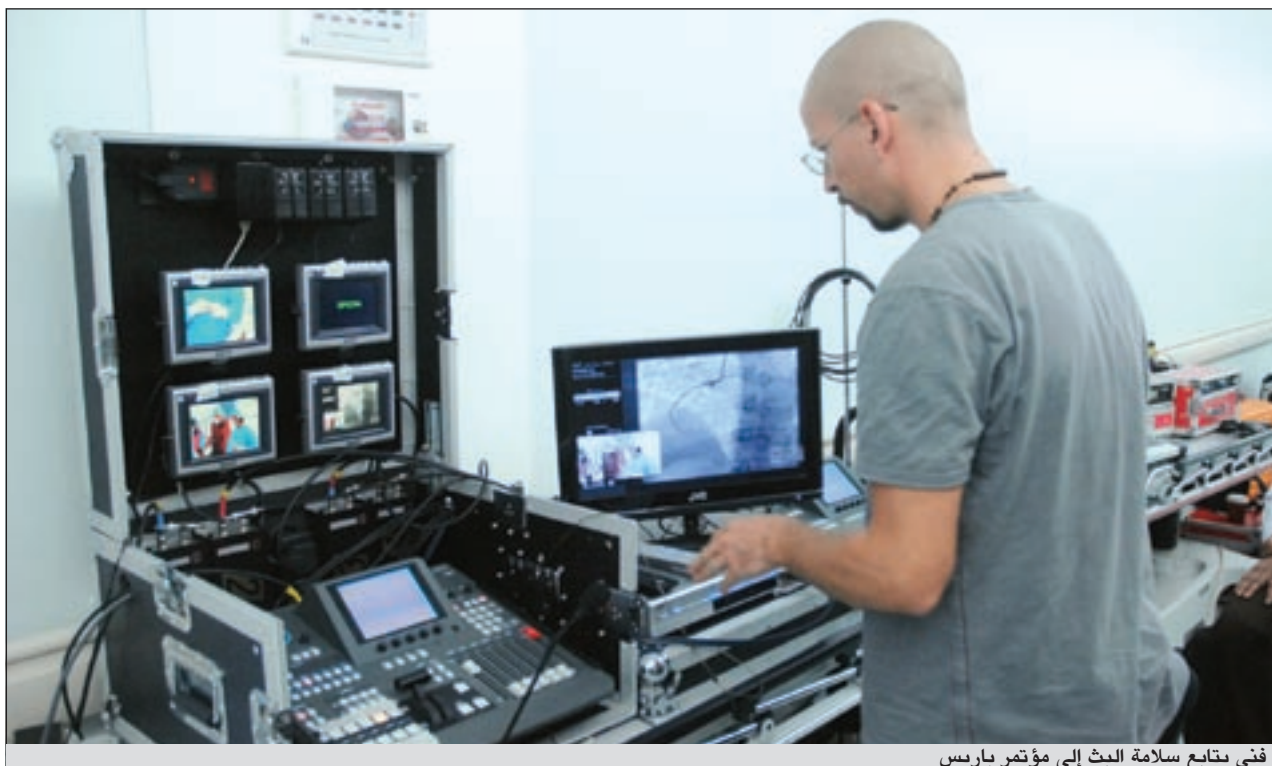
فني يتابع سلامة البث إلى مؤتمر باريس