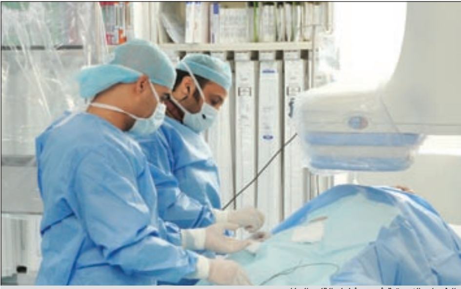
الخبرات الكويتية أبهرت أطباء القلب العالميين