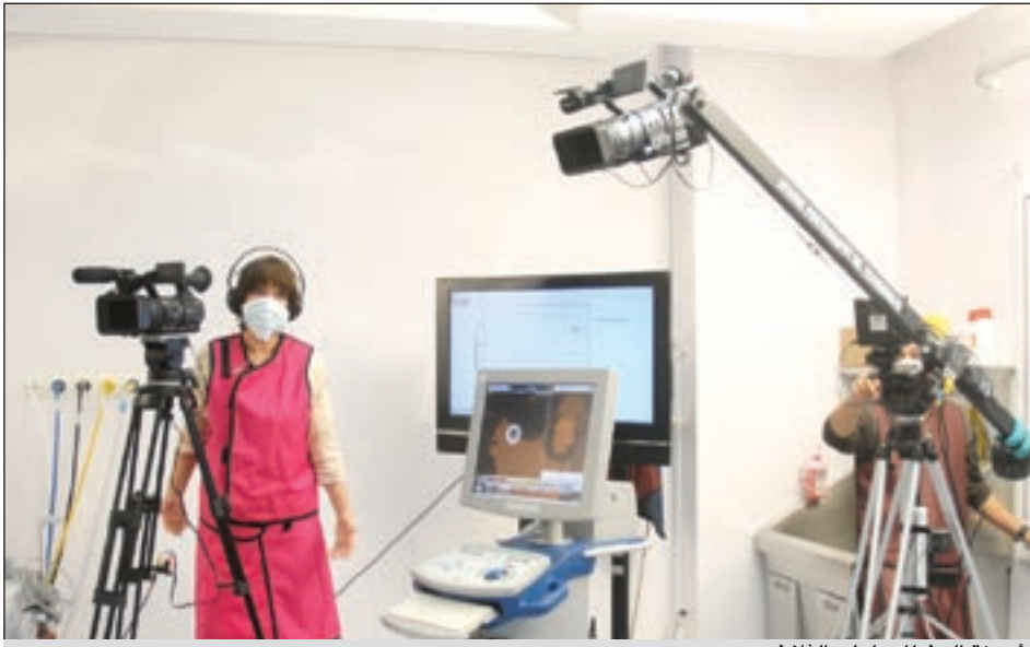
أجهزة البث للعمليات الثلاث