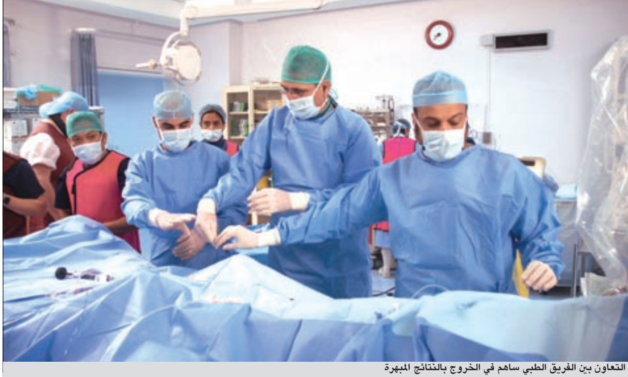
التعاون بين الفريق الطبي ساهم في الخروج بالنتائج المبهرة