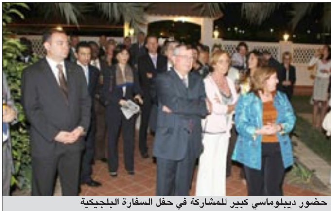
حضور ديبولماسي كبير للمشاركة في حفل السفارة البلجيكية