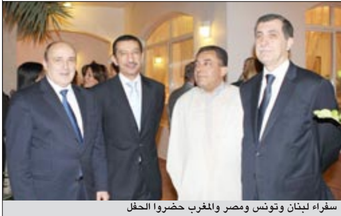
سفراء لبنان وتونس ومصر والمغرب حضروا الحفل

أكد سفير مملكة بلجيكا داميان انجليه عمق العلاقات التي تربط بلاده بالكويت واصفا اياها بأنها وثيقة وعريضة. وأضاف انجليه في تصريح للصحافيين لدى أقامته حفل استقبال مساء أول من أمس في مقر أقامته بالسلام بمناسبة الاحتفال باليوم الفرانكفوني الذي يصادف 20 الجاري «ان بلجيكا والكويت تجمعهما قواسم مشتركة، حيث يعدان بلدين صغيرين جغرافيا ومحاطين بدول كبرى، لافتا الى انهما يتشابهان في الأوضاع الأمنية التي مرا بها وواجهتا حروبا عنيفة في فترات تاريخية، مشيرا الى انه من هنا جاءت الحاجة للبحث عن بنيات ثنائية لتجاوز المصالح الوطنية البحتة وإقامة ميكانيزمات دولية وهو ما يوضحه وجود بلجيكا في الاتحاد الاوروبي ومنظمة الأمم المتحدة وكذلك بالنسبة للكويت التي بادرت بفكرة تأسيس مجلس التعاون الخليجي. وذكر ان التعاون الاقتصادي بين البلدين تحكمه الثقافة المشتركة للشركات والمؤسسات الاقتصادية وتاصيل الأطر ورجال الأعمال لتسيير مجالات اقتصادية مختلفة.