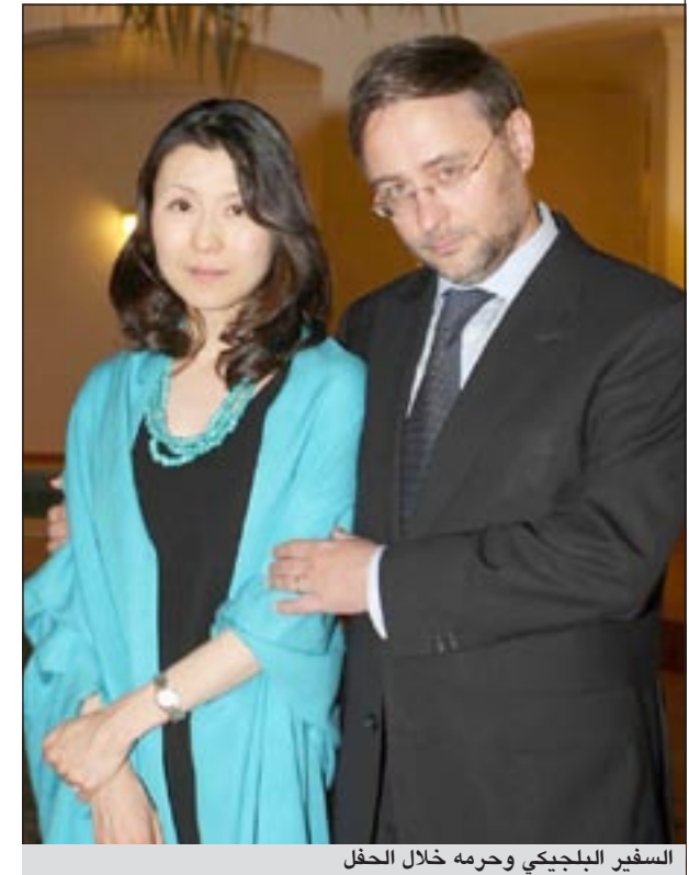
السفير البلجيكي وجرمه خلال الحفل