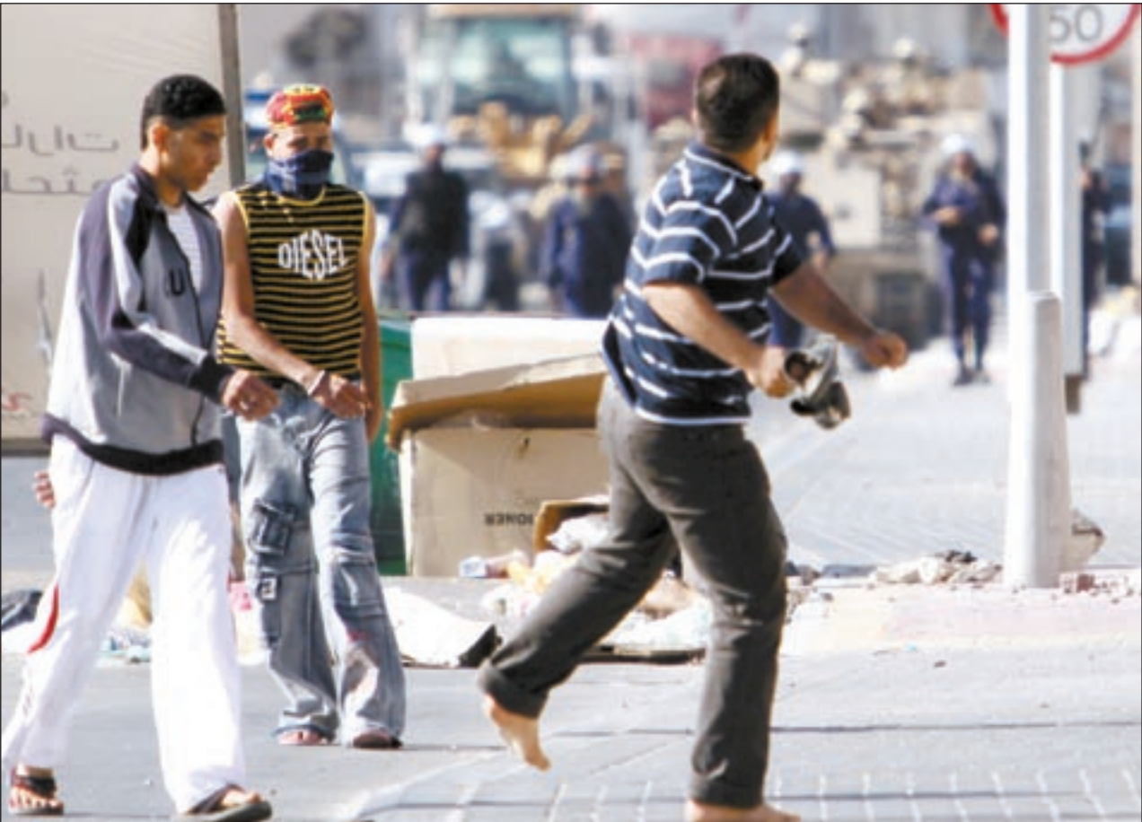
متظاهرون من قرية المالكية يرشقون قوات الأمن البحرينية بالحجارة (إ.ب)

وتراجعت جمعية الوفاق عن شروط أكثر طوعاً وحدتها الأسبوع الماضي لإجراء المحادثات التي دعا إليها ولي العهد صاحب السمو الملكي الأمير سلمان بن حمد.