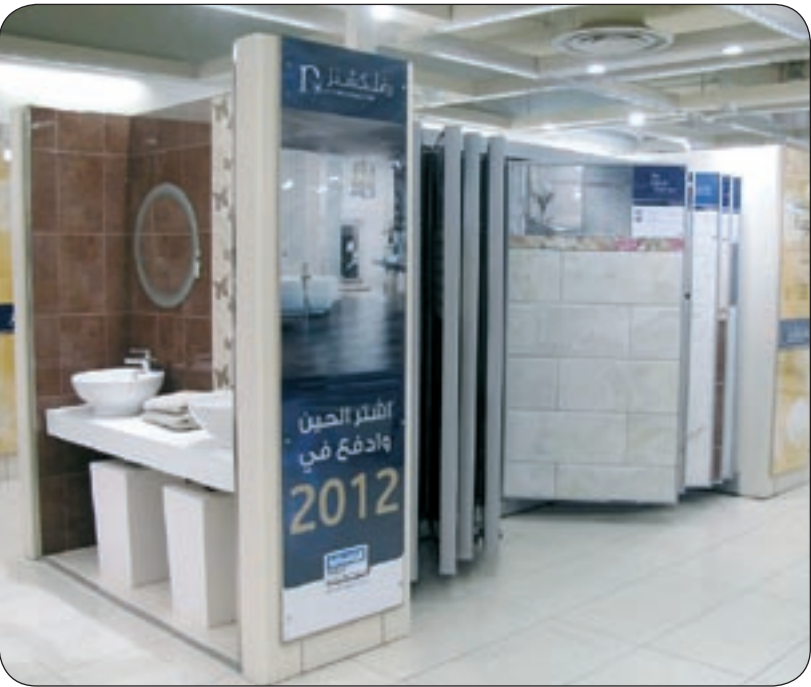
جانب من صالة عرض «رفلكشنز»

كما تفخر «رفلكشنز» بالإعلان عن وصول تشكيلة الربيع من تصاميم جديدة للحمامات التي من شأنها اغتاء المنازل بلمسة عصرية أو كلاسيكية