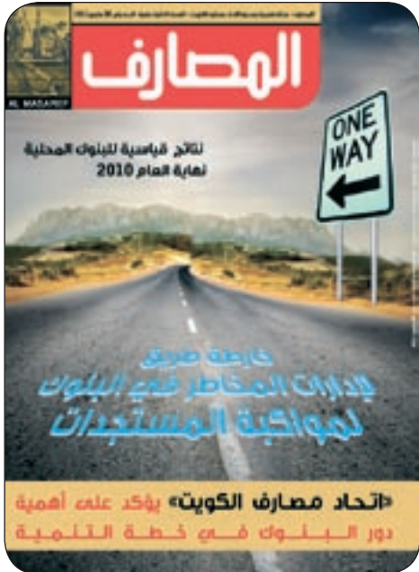
غلاف العدد الجديد من المجلة

المحلية أو على مستوى لجنة بازل وتعليماتها الرقابية والإشرافية الرامية إلى تحقيق الملاءة المالية لدى البنوك في كل الأوقات.