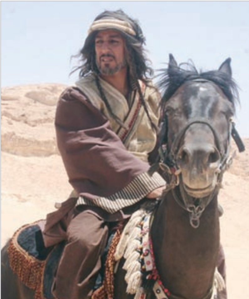
الممثل السعودي عبدالحسن النمر

الرياض - إيلاف: تأكدت مشاركة عبدالحسن النمر كلا من المخرج حاتم العلي والفنان السوري غسان مسعود في مسلسل «الفاروق». وأوضح النمر قبلا أنه بصدد تقديم عمل مع المخرج حاتم العلي، الذي لم ير بدبلا عنه ليطبل به على الجماهير في شهر رمضان المقبل، وذلك في شخصية «أبو حذيفة بن عتبة»، أخو هند زوجة أبو سفيان، عم يزيد بن معاوية.