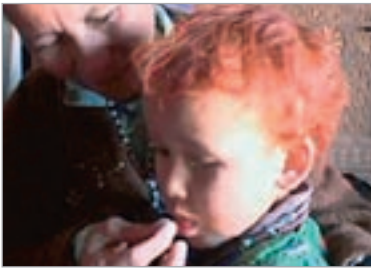
أم تطعم طفلها الأفيون