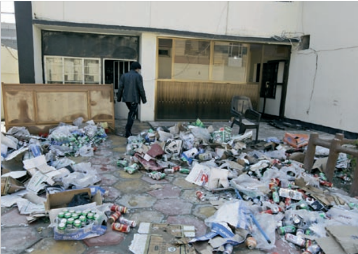
أحد الاوكار التي تمت مدامتها

الرجال جمعية آشور بانينبال الثقافية وان ضباط شرطة حاولوا دخول ناد شهير آخر قائلين انهم يحققون في بيع مشروبات كحولية. وأصبح بيع المشروبات الكحولية مقباسا لارتجاليا للتوجهات في العراق منذ سقوط الرئيس المقبور صدام حسن وصعود القوة السياسية للغالبية الشيعية.