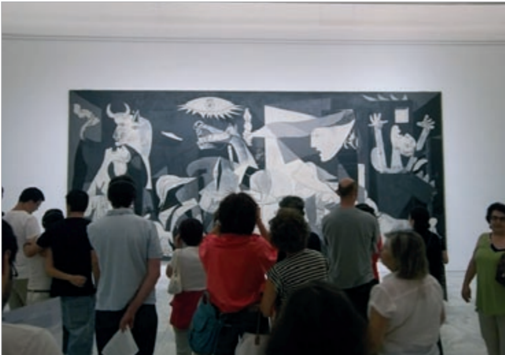
إحدى لوحات بيكاسو في أحد المعارض

النمسا - د.ب.أ: يوفر متنزّه هورنبارك للتسلق والمغامرة عبر جبال الالب والقريب من منطقة سانت جوهان الواقعة في مرتفعات تيرول بجبال الالب مصر جذب جديدا يتمثل في الاستمتاع بالانارة من خلال التحليق عاليا فوق المناظر الطبيعية المغطاة بالثلوج عبر الاسلاك او الكابلات المعلقة. وقال مكتب السياحة الاقليمي ان مسافة التحليق التي يتم خلالها تعليق المغامر أو المقعد الخاص به باستخدام خطاطيف وحبال في الاسلاك القوية لمشاهدة المناظر الطبيعية تمتد بطول 531 مترا وعلى ارتفاع يصل الى 21 مترا فوق الارض، ويمر مسار التحليق باستخدام الكابلات المعلقة فوق بحيرة متجمدة بجبال الالب، بالإضافة الي عدد من التضاريس الأخرى التي يتمتع المغامر بمشاهدتها، ويتراوح سعر التذكرة بين 13 يورو للأطفال و20 يورو للكبار (ما بين 17 الى 26 دولارا).