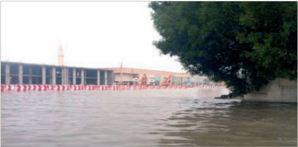
الأمطار تغرق الرياض

الوصول بجاهزية المحطات إلى نسبة 100٪ ويتم تشغيل المحطات بواسطة مشغلين متواجدين على مدار الساعة مع المرور الدوري والمستمر لفقرق الصيانة على جميع المحطات حرصا على ضمان الاحتفاظ بالكفاءات التشغيلية المطلوبة.