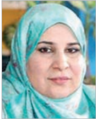
اسماء بن قاتدة

فيما يرى الشيخ علي أبو الحسن رئيس اللجنة الفتوى بالأزهر سابقا أن الشيخ القرضاوي ليس بأفضل من الأنبياء والرسل، فقد عانوا من مشاكل أسرية متعددة، قال لـ «إيلاف»: الرسول ﷺ عانى من غيرة زوجاته بعضهن من البعوض، ومن غيرتهن من زوجته الأولى السيدة خديجة رضوان الله عليها، وروي عن السيدة عائشة رضي الله عنها أنها قالت: كان رسول الله ﷺ لا يكاد يخرج من البيت حتى يذكر خديجة، فيحسن الغناء عليها، فكفر خديجة يوما من الأيام، فادركتني الغيرة، فقلت: هل كانت إلا عجوزا فإبدلك الله خيرا منها؟ فغضب حتى اهتز مقدم شعره من الغضب، ثم قال: لا والله ما أبدلني الله خيرا منها، أمنت بي إذ كفر الناس، وصدقتني إذ كذبنى الناس، ورزقني الله منها أولادا إذ حرمني النساء، قالت عائشة: فقلت في نفسي لا أنكرها بسيئة أبدا».