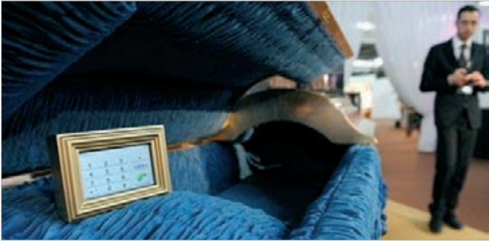
تابوت بهاتف في إيطاليا

كالسبرغ الدنماركية لصناعة البيرة إضرابا لمدة أسبوع احتجاجا على تخفيض الخصصات اليومية التي كانوا يحصلون عليها من البيرة. وكانت الإدارة قررت تخفيض هذه الخصصات في ثلاث زجاجات إلى زجاجة واحدة يوميا لكل عامل.