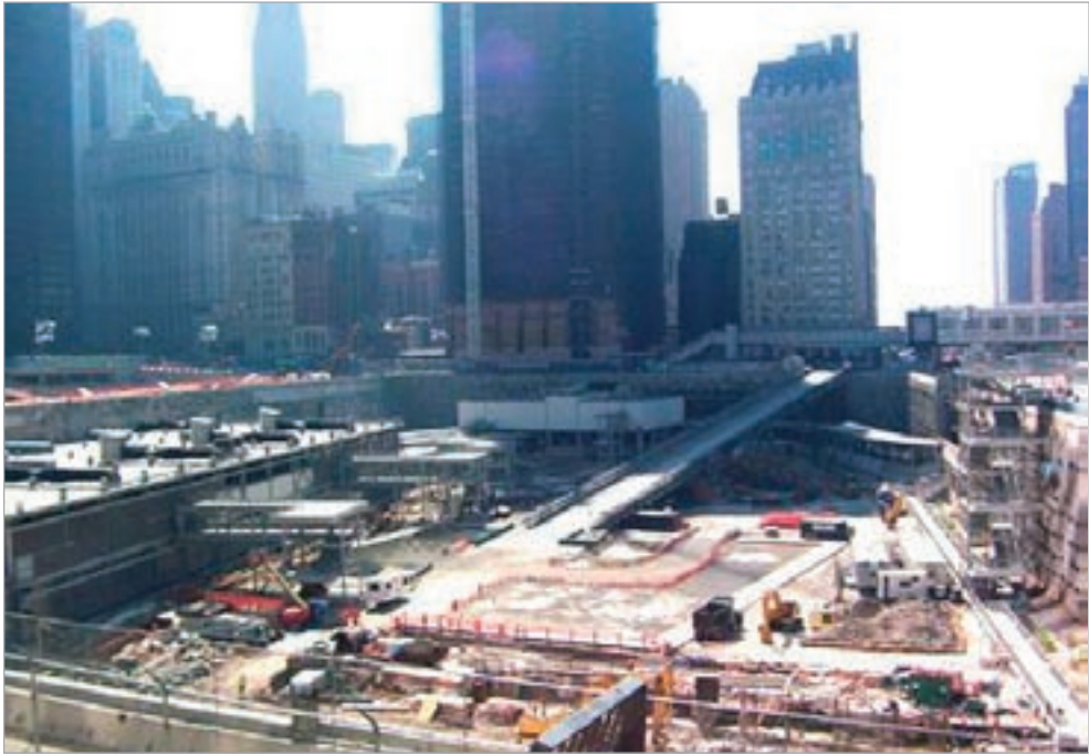
موقع «غراوند زيرو»